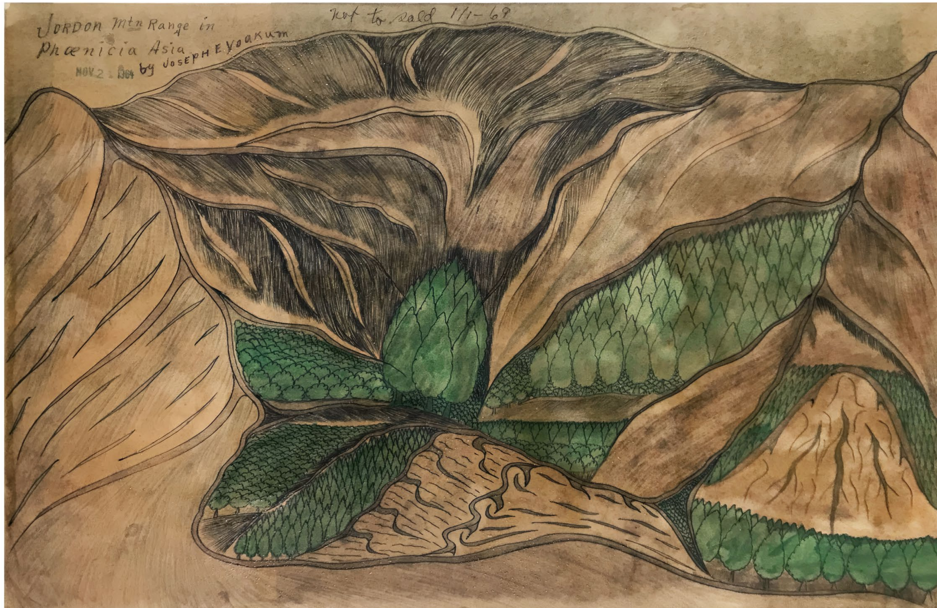
Joseph Elmer Yoakum Jordon Mtn Range in Phœnicia Asia , 1964, encre, crayon de couleur, mine graphite, tampon et fixatif sur papier, 30,1 × 45,2 cm

ART BRUT / donation Bruno Decharme au MNAM-CP / 2021