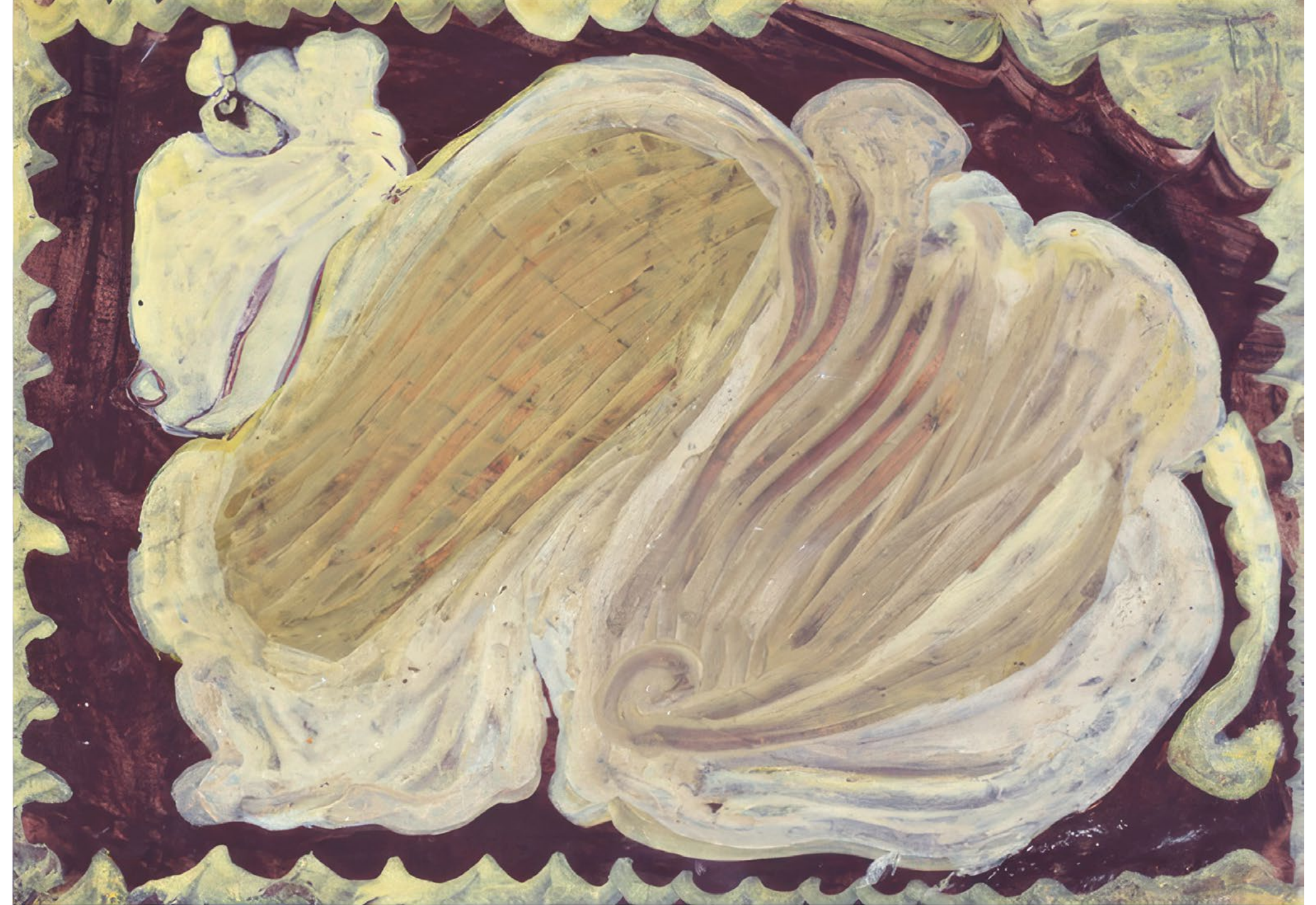
Eugen Gabritschewsky Sans titre, vers 1950, gouache sur papier, 20,9 x 29,5 cm

ART BRUT / donation Bruno Decharme au MNAM-CP / 2021