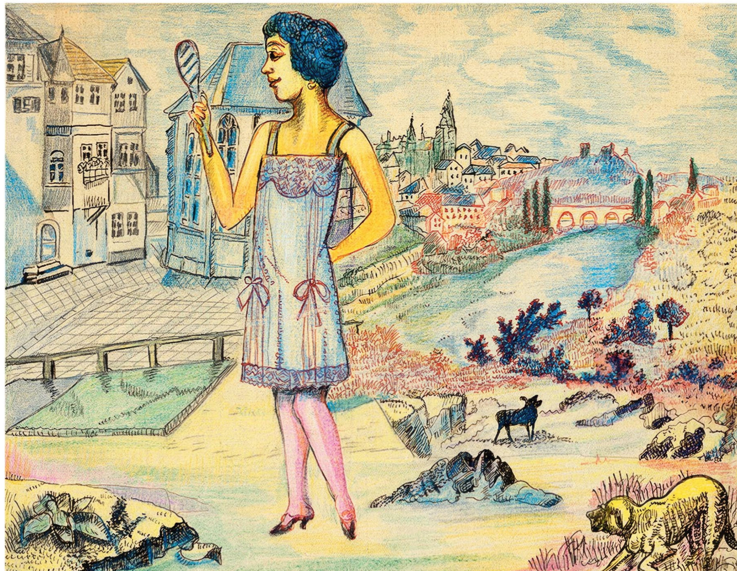
Hans Farni Sans titre, entre 1920 et 1930, encre, crayon de couleur et mine graphite sur papier, 20,7 x 26,5 cm

ART BRUT / donation Bruno Decharme au MNAM-CP / 2021