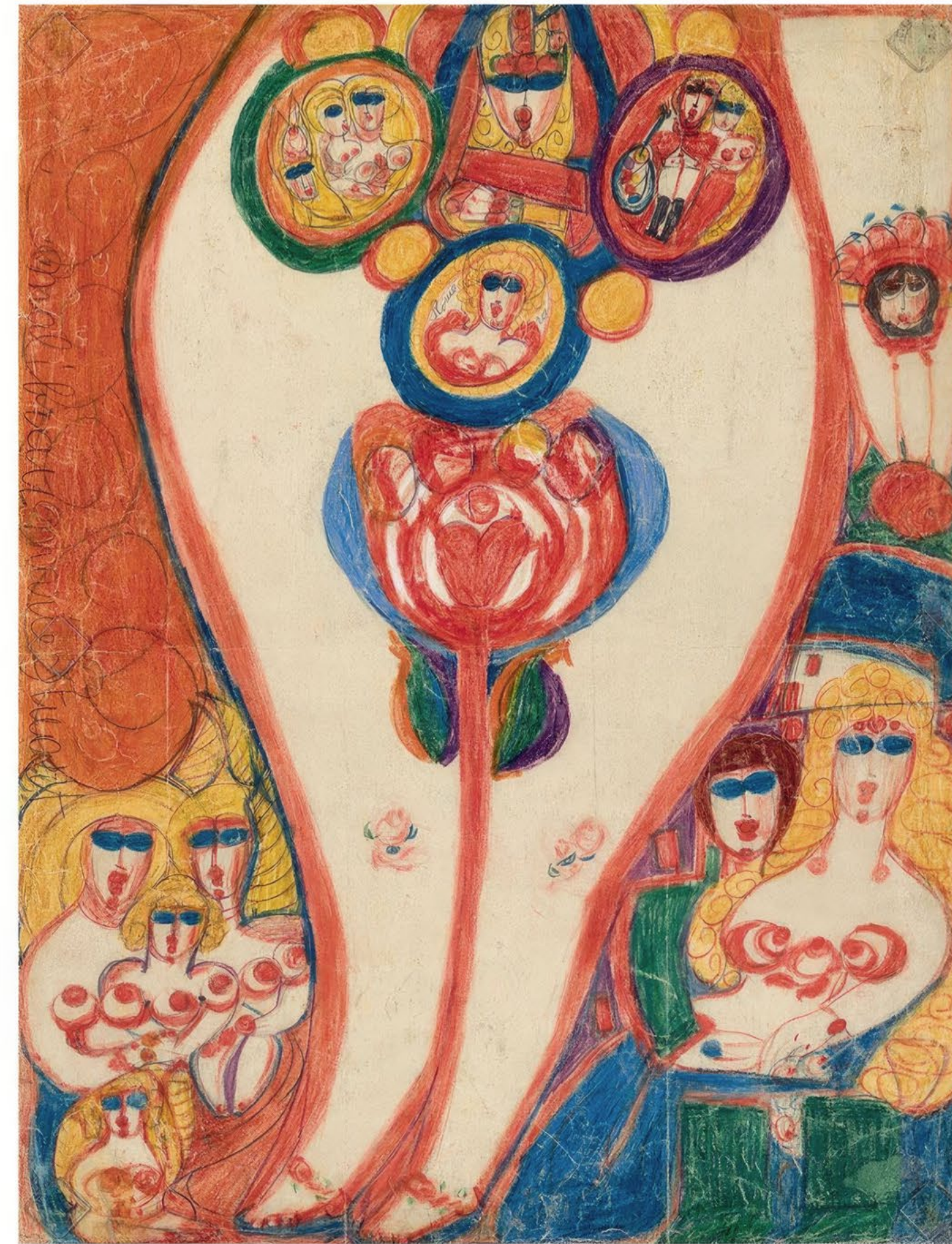
Aloïse Corbaz Collier en serpent et Malibran Marie Stuart , recto verso, vers 1956, pastel gras et mine graphite sur papier, 58 × 44 cm