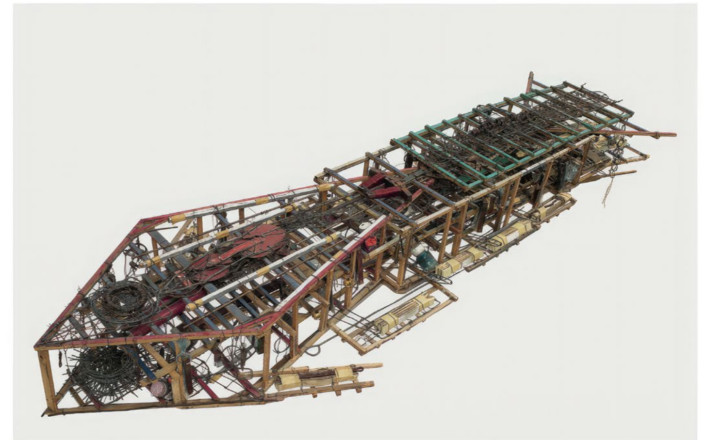
Emery Blagdon Rocket, entre 1956 et 1986, bois, métal (cuivre, aluminium), scotch, papier, plastique, film plastique, verre, condensateurs chimiques, batterie, 21,2 × 152,5 × 54 cm

ART BRUT / donation Bruno Decharme au MNAM-CP / 2021