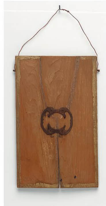
Emery Blagdon Sans titre, entre 1956 et 1986, bois, métal, film plastique, 15,1 × 9,2 × 2,8 cm

ART BRUT / donation Bruno Decharme au MNAM-CP / 2021