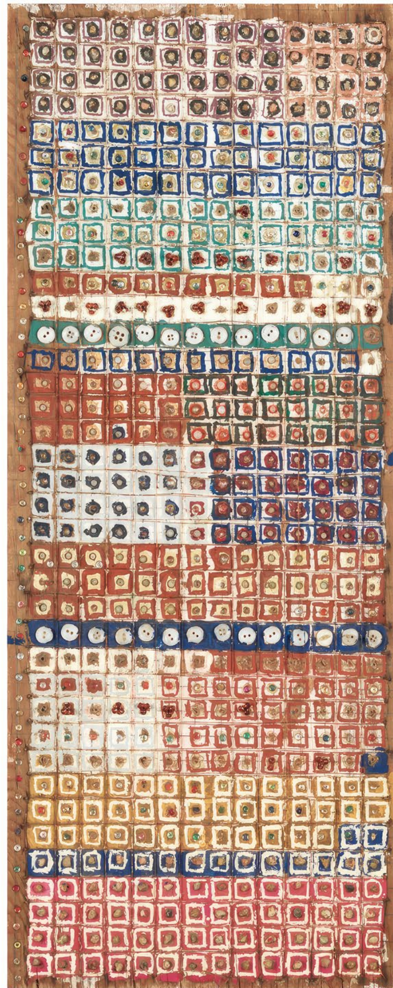
Emery Blagdon Sans titre, entre 1956 et 1986, clous, fils de cuivre, plastique, nacre, pierres, paillettes, boutons, peinture et crayon graphite sur contreplaqué, 80,2 × 31,2 × 1,8 cm

ART BRUT / donation Bruno Decharme au MNAM-CP / 2021