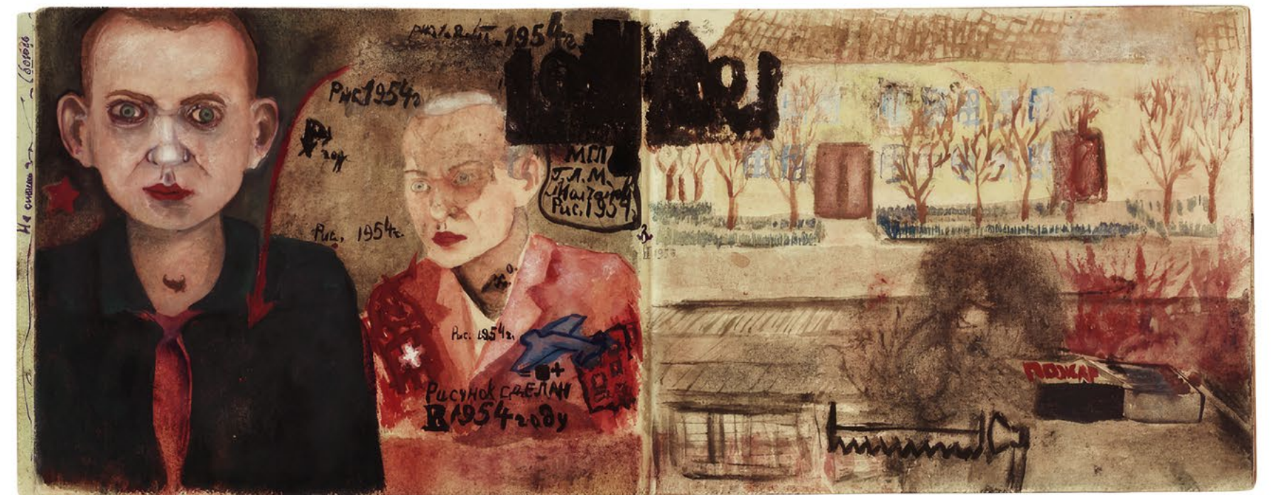
Anonyme (Russie) Sans titre [carnet], 1954, Gouache et encre sur cahier de 50 pages, 14,8 x 20,2 x 0,7 cm (carnet fermé)

ART BRUT / donation Bruno Decharme au MNAM-CP / 2021