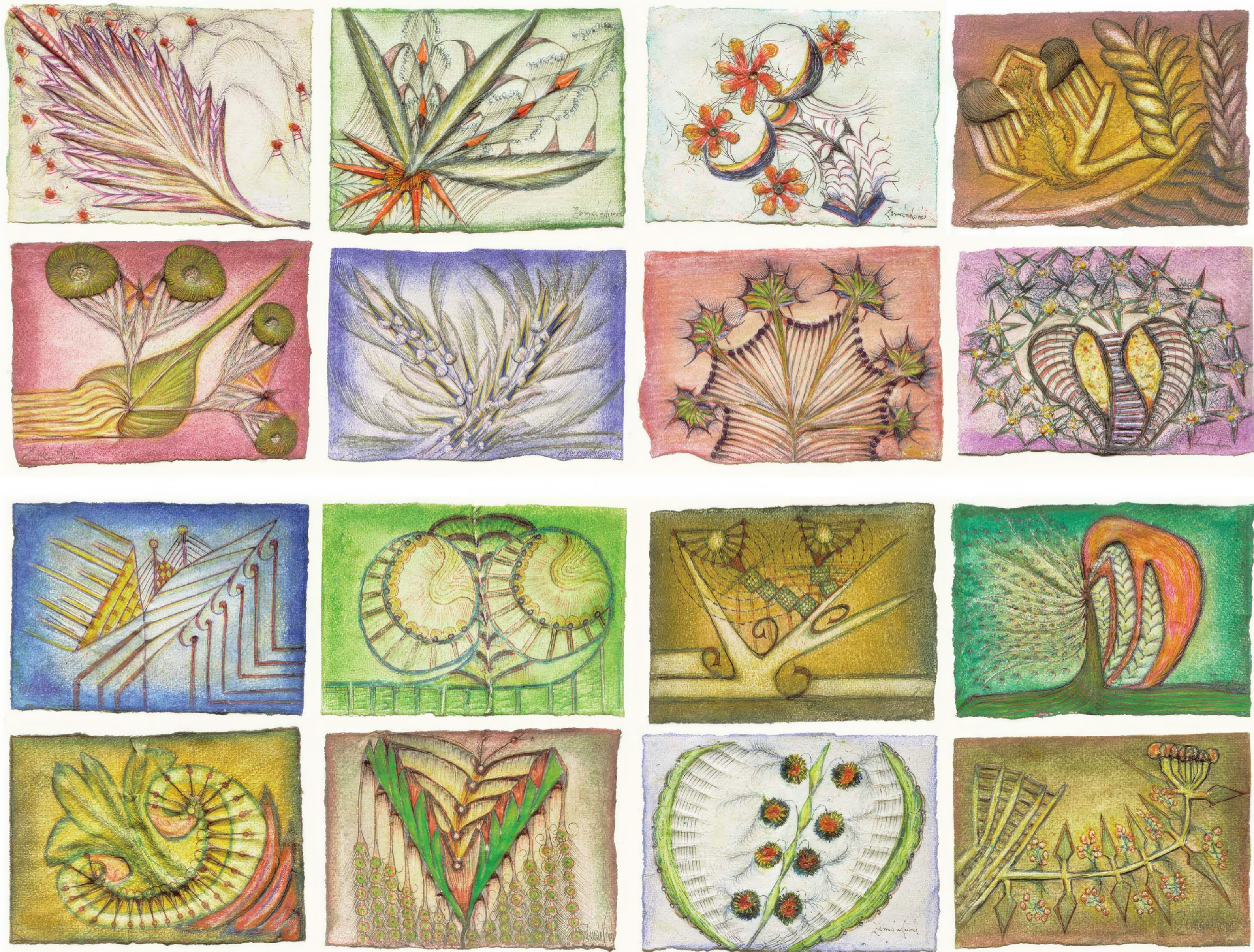
Anna Zemánková Sans titre, vers 1965, mine graphite, pastel sur papier, 7,5 x 10,5 cm (chacun)

ART BRUT / donation Bruno Decharme au MNAM-CP / 2021