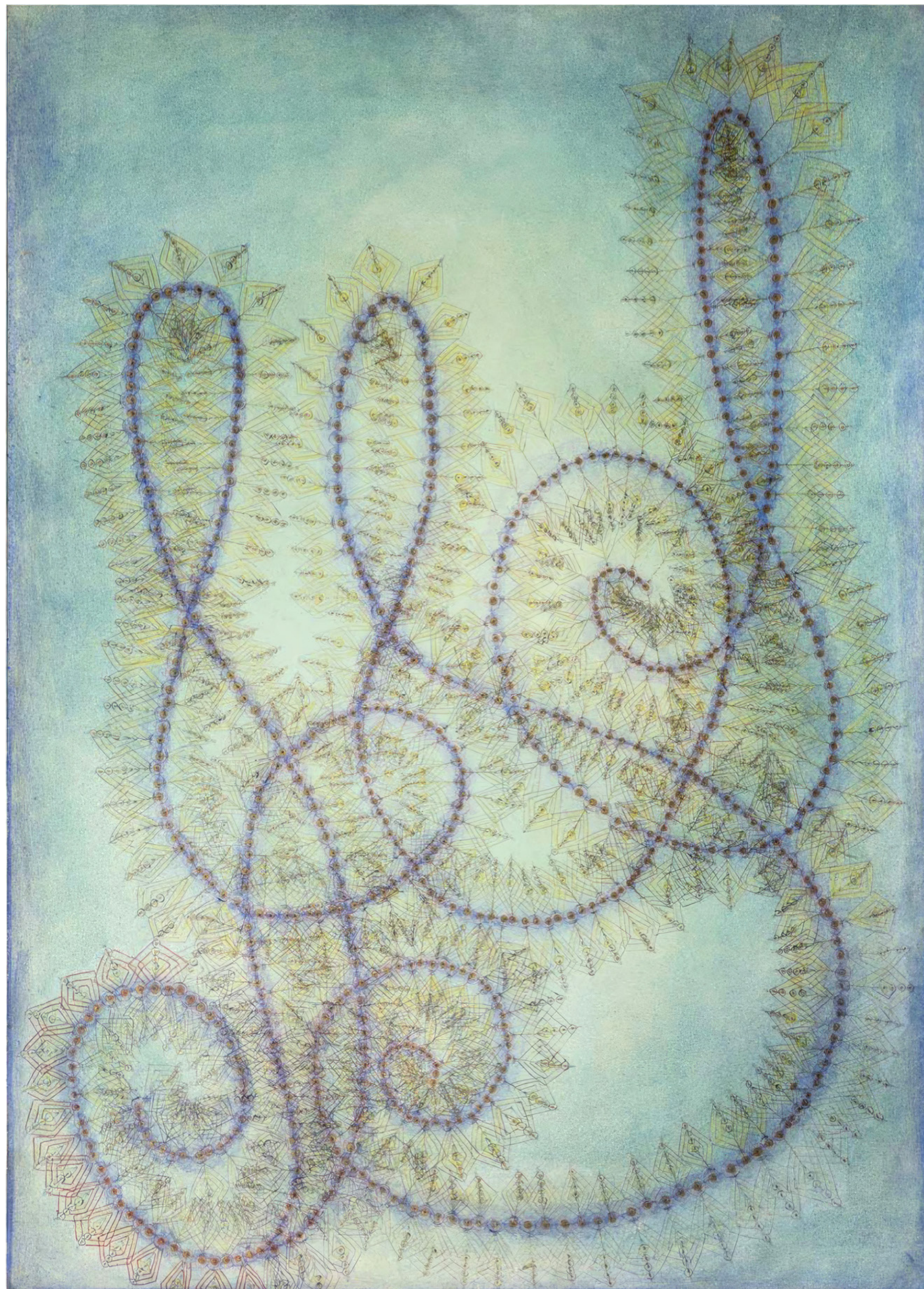
Anna Zemánková Sans titre, entre 1965 et 1973, pastel, encre, huile sur papier, 62,5 x 45 cm