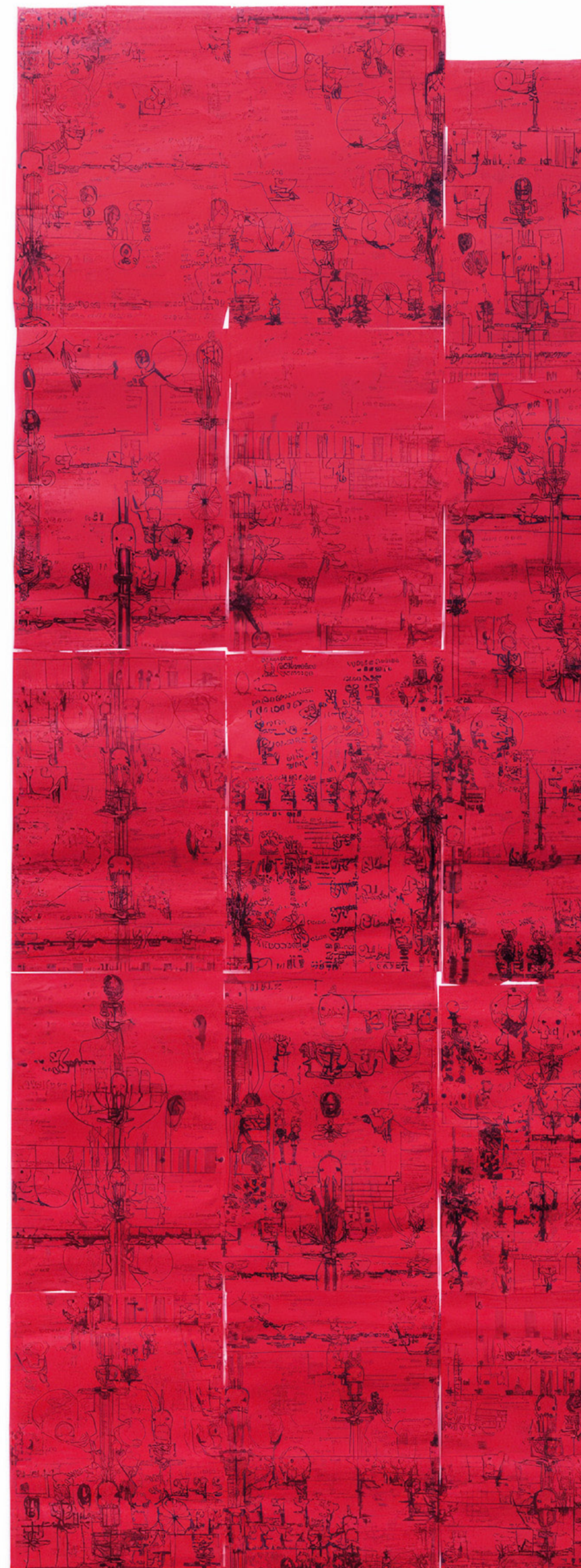
Shun Yonaha Sans titre, 2016, de l'ensemble Gaikotsu Story's en 3 lais, encre sur papier rouge, 196,8 x 82,5 cm (chacun)

ART BRUT / donation Bruno Decharme au MNAM-CP / 2021