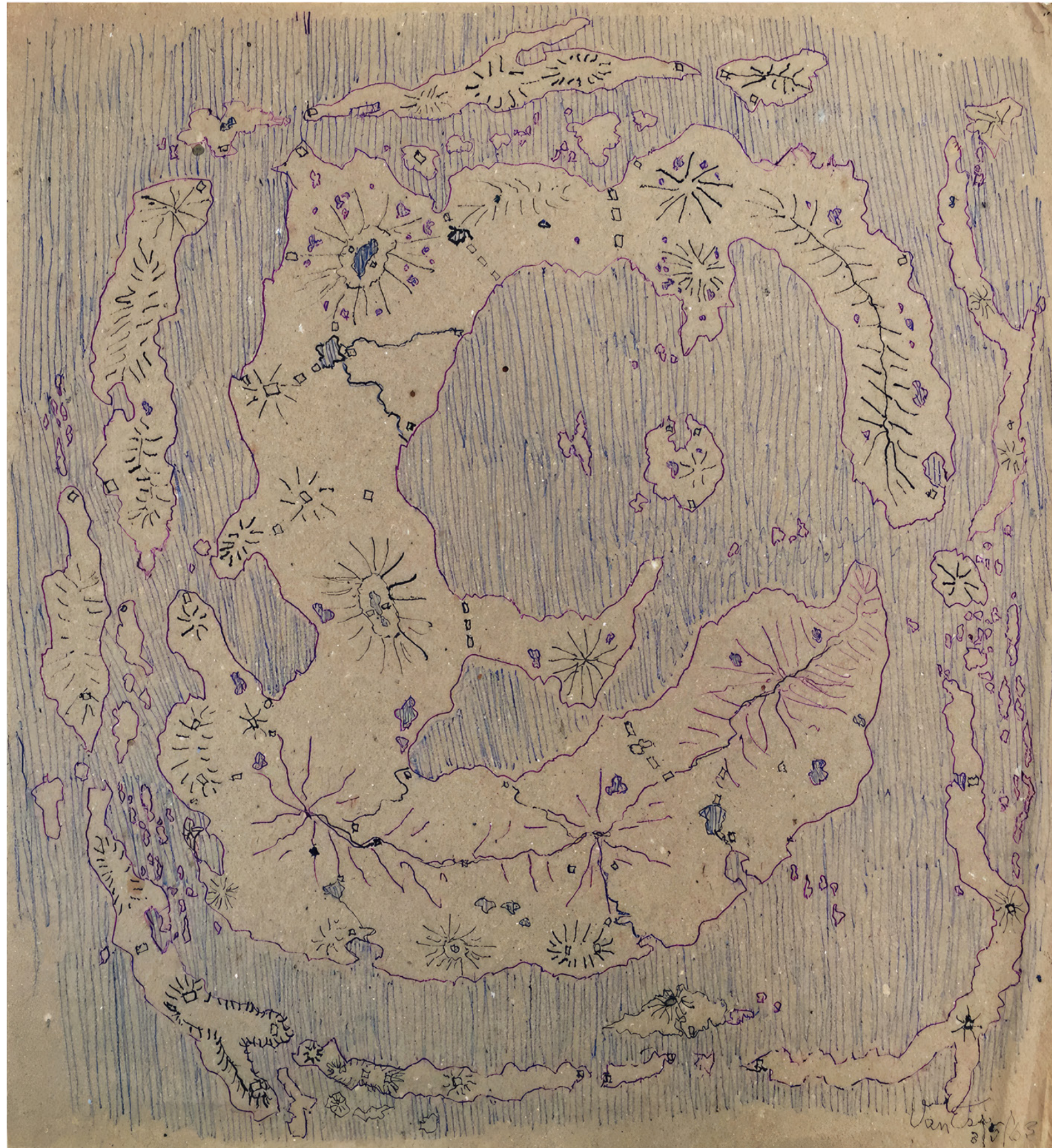
Warren Van Ess Sans titre, 1963, encre et stylo à bille rouge et bleu sur papier, 28 x 25,6 cm

ART BRUT / donation Bruno Decharme au MNAM-CP / 2021