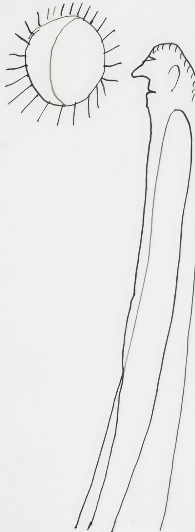
Oswald Tschirtner Der Mann im Mond , paraphé O.T., daté 1979, encre sur papier, 20,7 × 14,8 cm

ART BRUT / donation Bruno Decharme au MNAM-CP / 2021