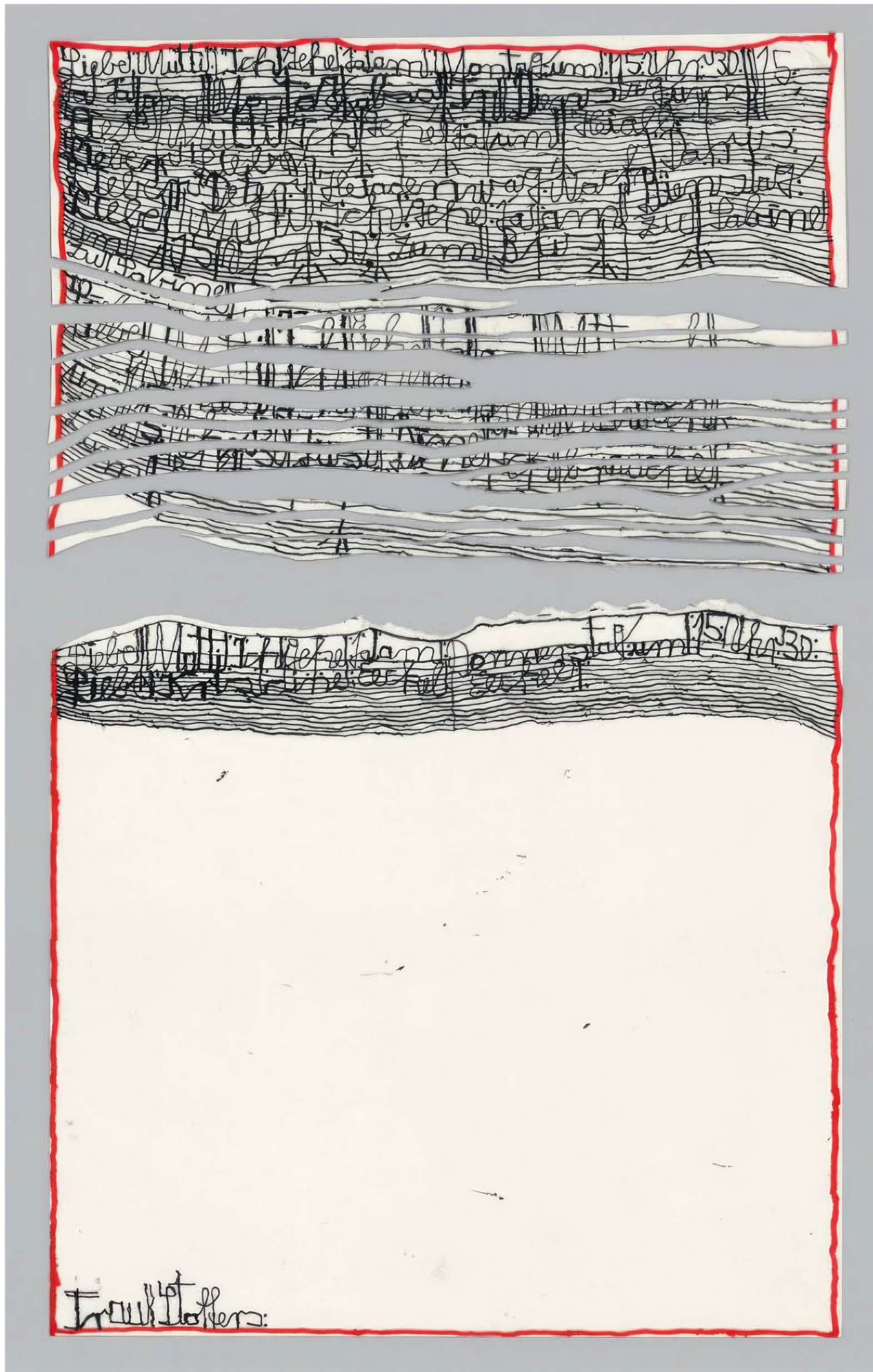
Harald Stoffers Sans titre, 2012, Encre sur papier, 48,2 x 29,5 cm

ART BRUT / donation Bruno Decharme au MNAM-CP /