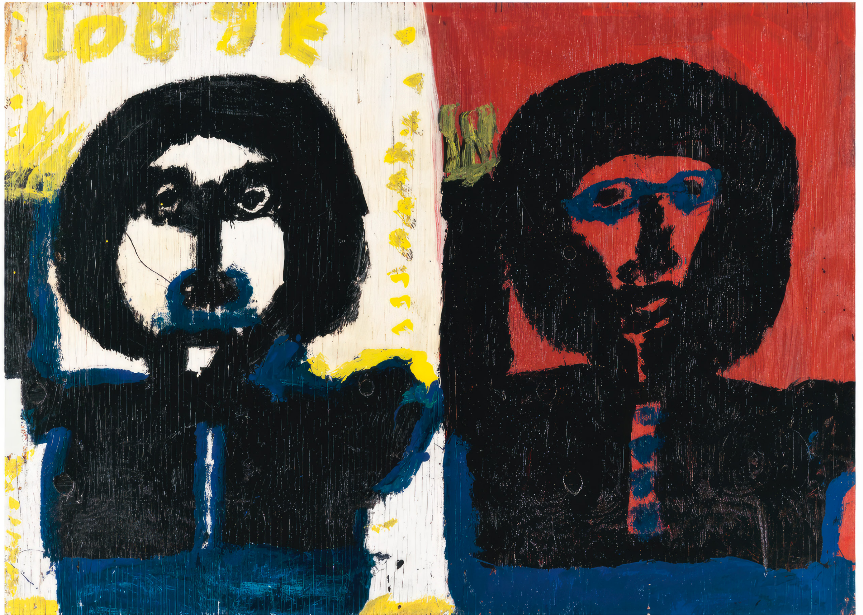
Mary T. Smith, Sans titre, vers 1980, Ripolin sur contreplaqué, 87,5 × 122 × 0,9 cm

ART BRUT / donation Bruno Decharme au MNAM-CP / 2021