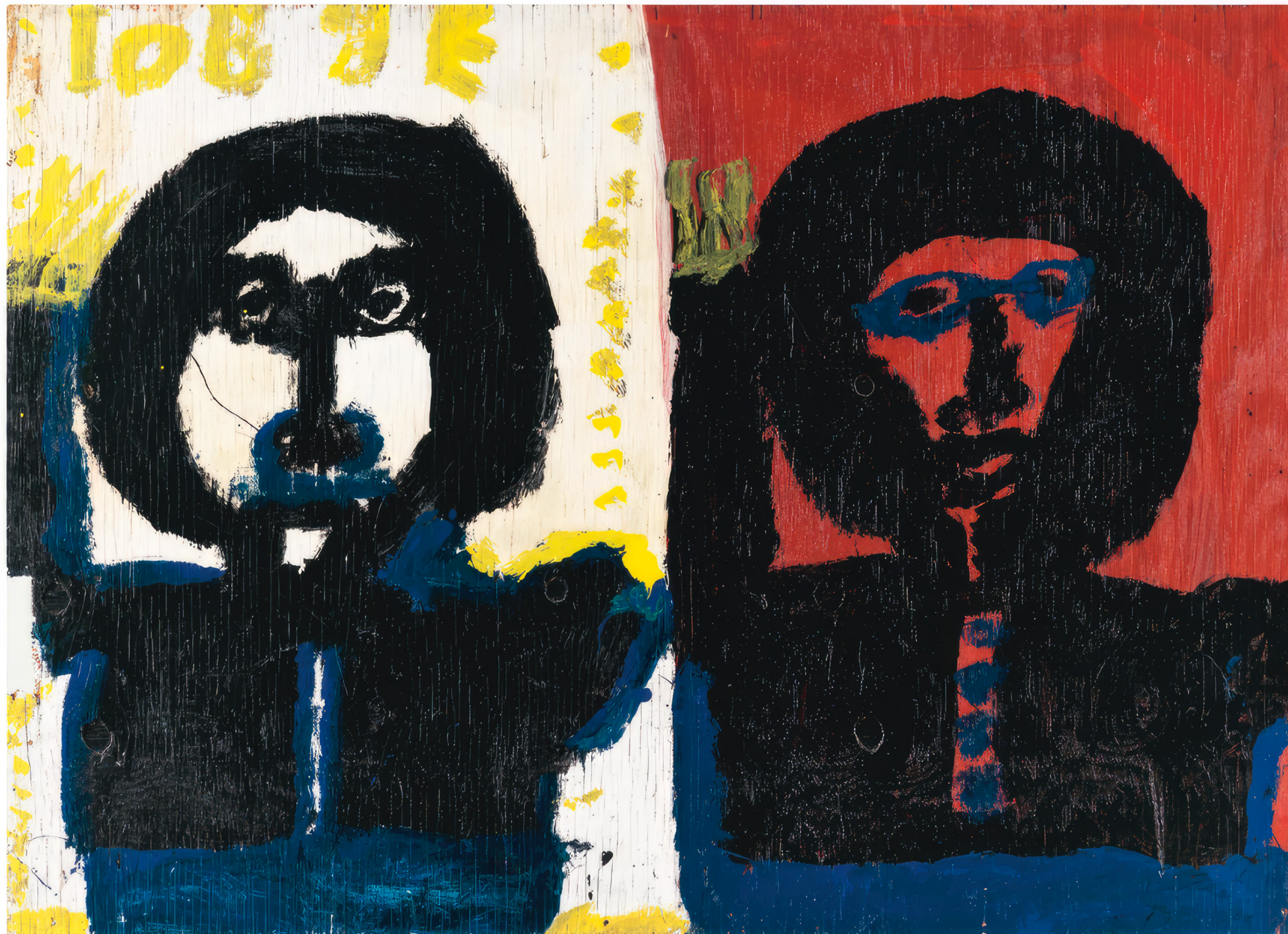
Mary T. Smith, Sans titre, vers 1980, Ripolin sur contreplaqué, 87,5 × 122 × 0,9 cm

ART BRUT / donation Bruno Decharme au MNAM-CP / 2021