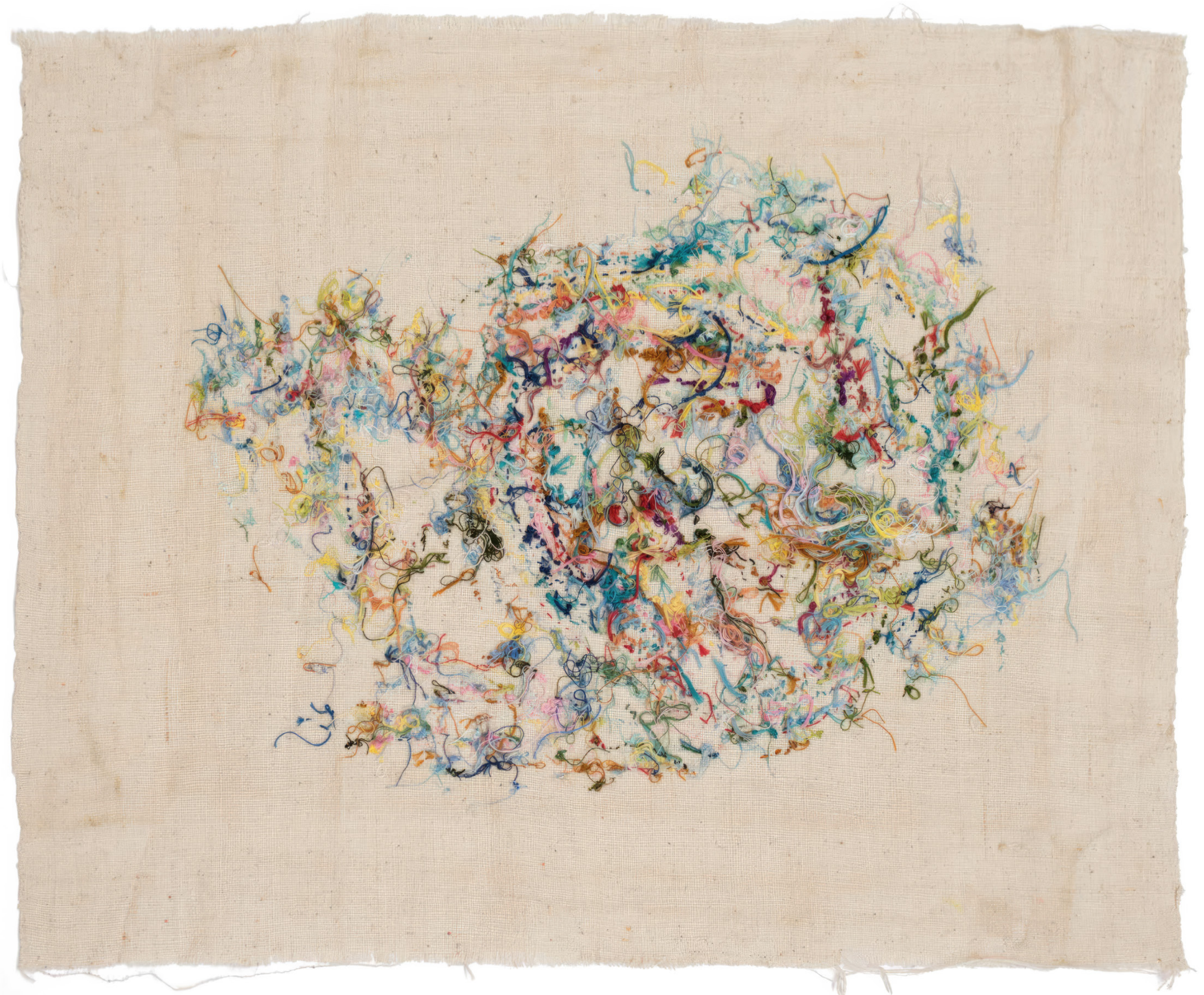
Misuzu Seko Sans titre, s.d, broderie de coton sur toile de coton, 49 x 59 cm

ART BRUT / donation Bruno Decharme au MNAM-CP / 2021