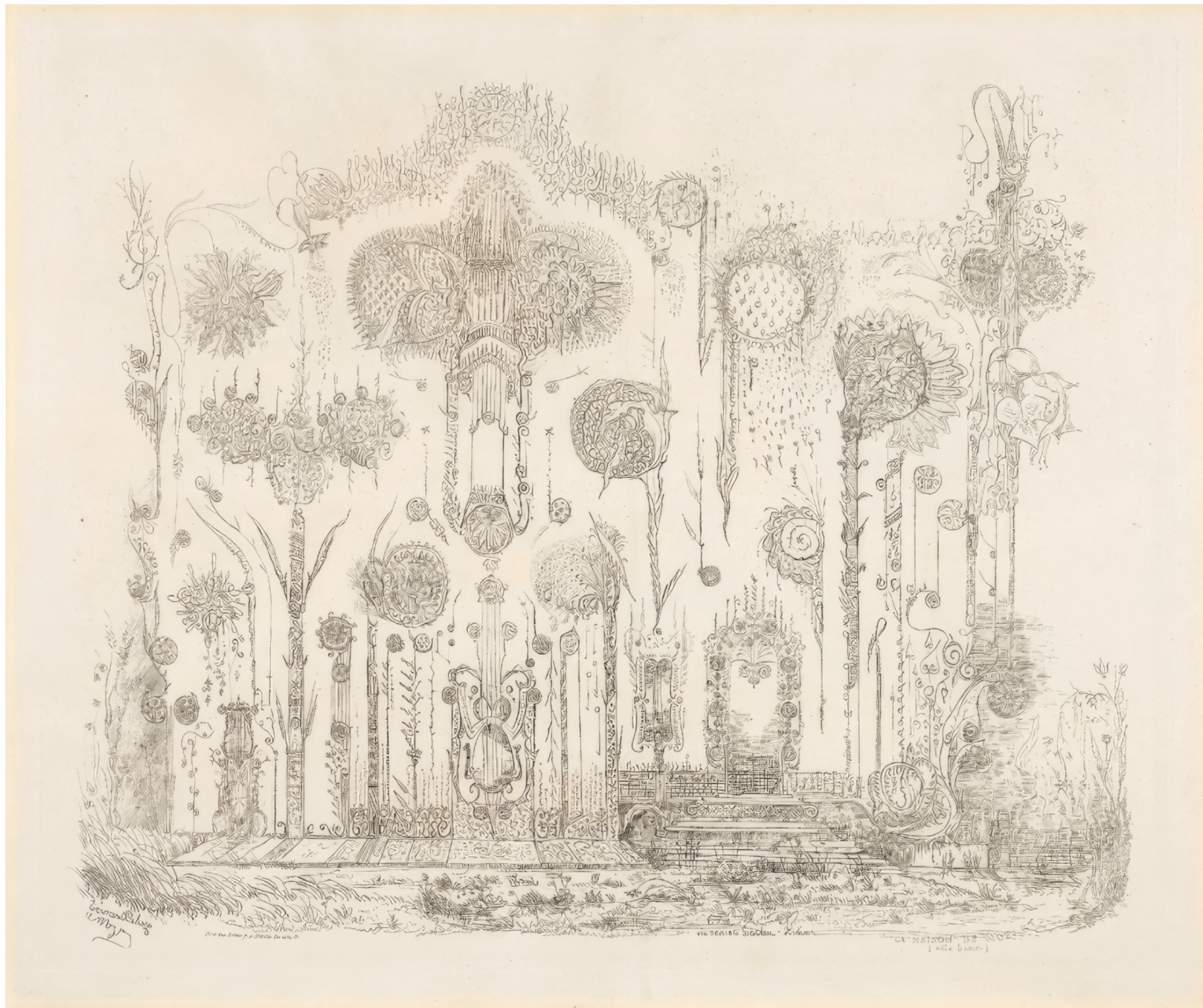
Victorien Sardou La Maison de Mozart , vers 1860, eau-forte, 39,5 × 47,7 cm

ART BRUT / donation Bruno Decharme au MNAM-CP / 2021