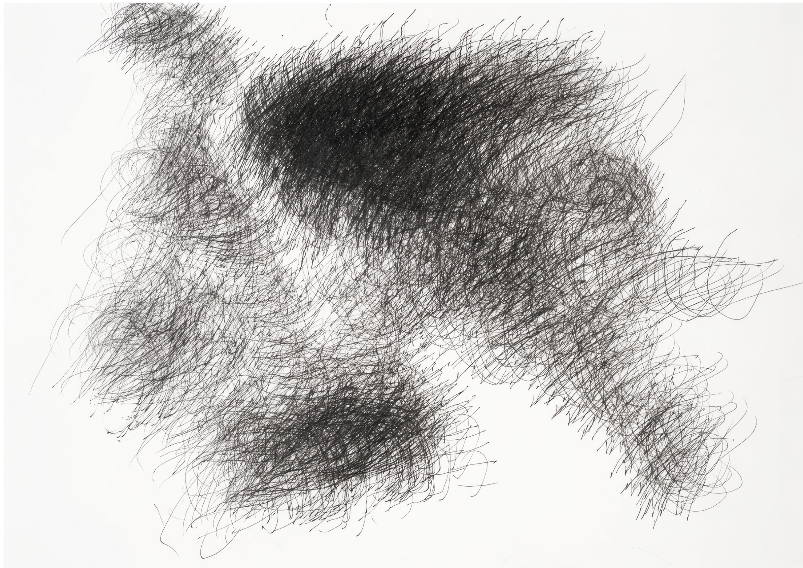
Yuichi Saito Sans titre, vers 2005, encre sur papier, 38 x 54 cm

ART BRUT / donation Bruno Decharme au MNAM-CP / 2021