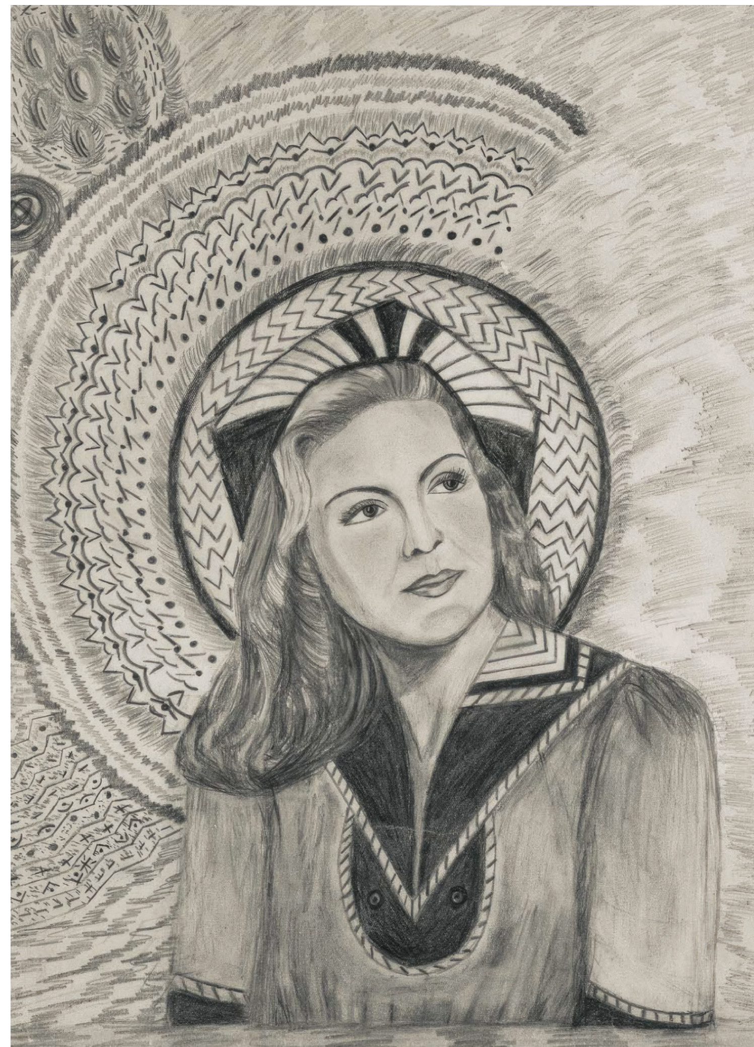
Miloslava Ratzingerová Sans titres, entre 1935 et 1950, mine de plomb sur papier, 43,5 × 31,7 cm et 42,5 x 32,5 cm

ART BRUT / donation Bruno Decharme au MNAM-CP / 2021