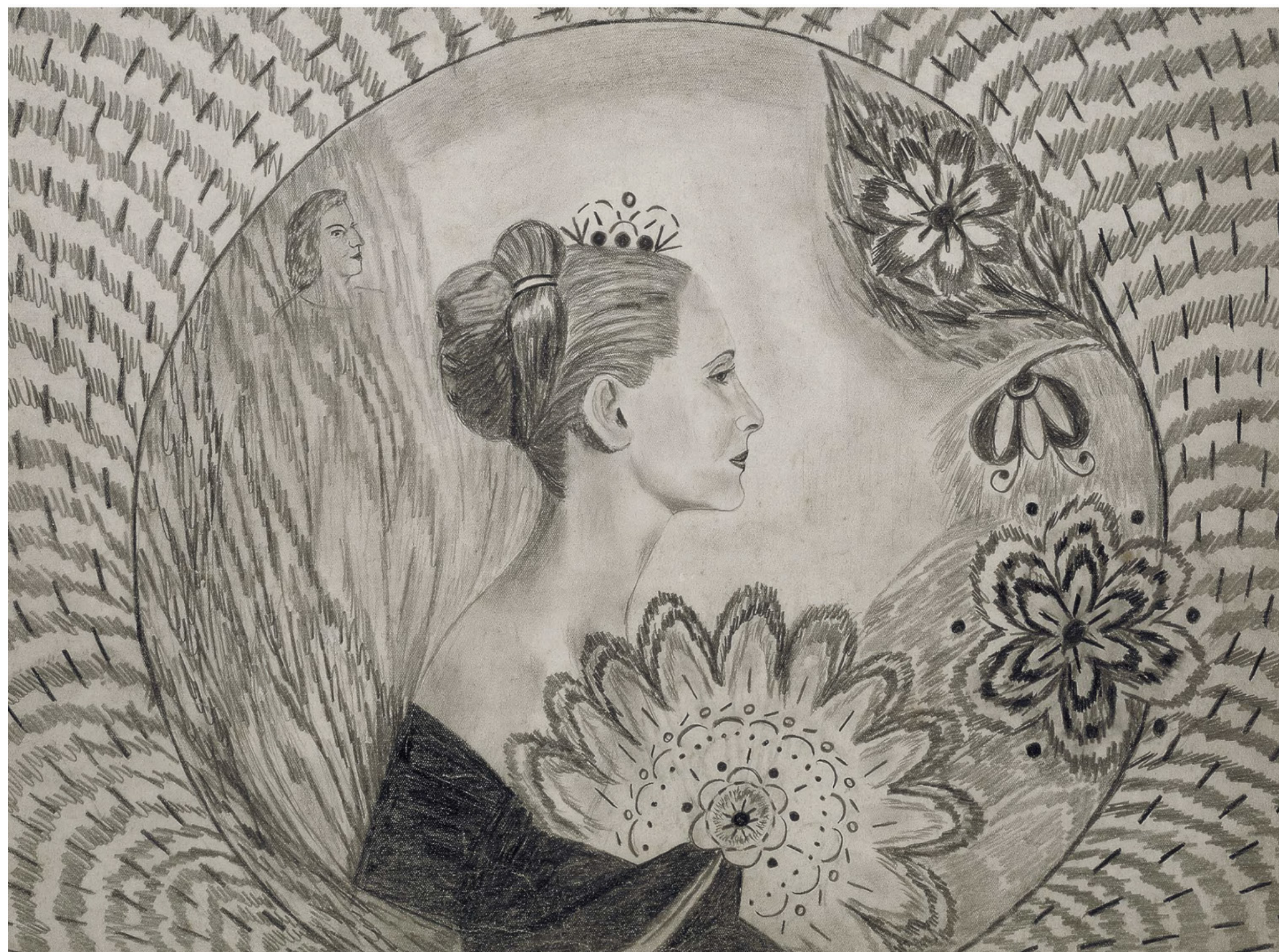
Miloslava Ratzingerová Sans titres, entre 1935 et 1950, mine de plomb sur papier, 32,5 x 42,5 cm et 44 x 32 cm

ART BRUT / donation Bruno Decharme au MNAM-CP / 2021