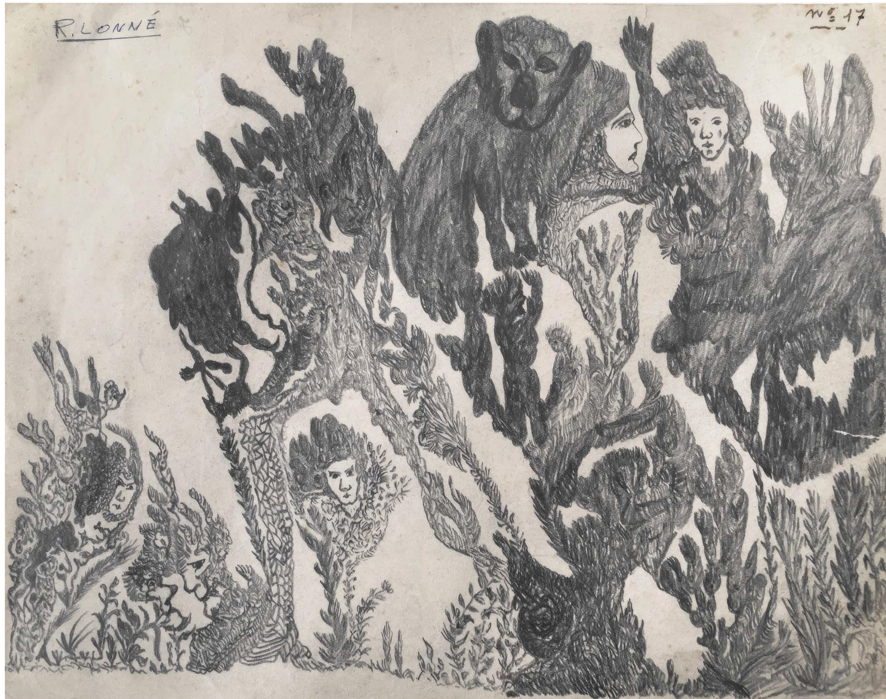
Raphaël Lonné Sans titre, 4 mai 1950, mine graphite sur papier, 21 × 27,5 cm

ART BRUT / donation Bruno Decharme au MNAM-CP / 2021