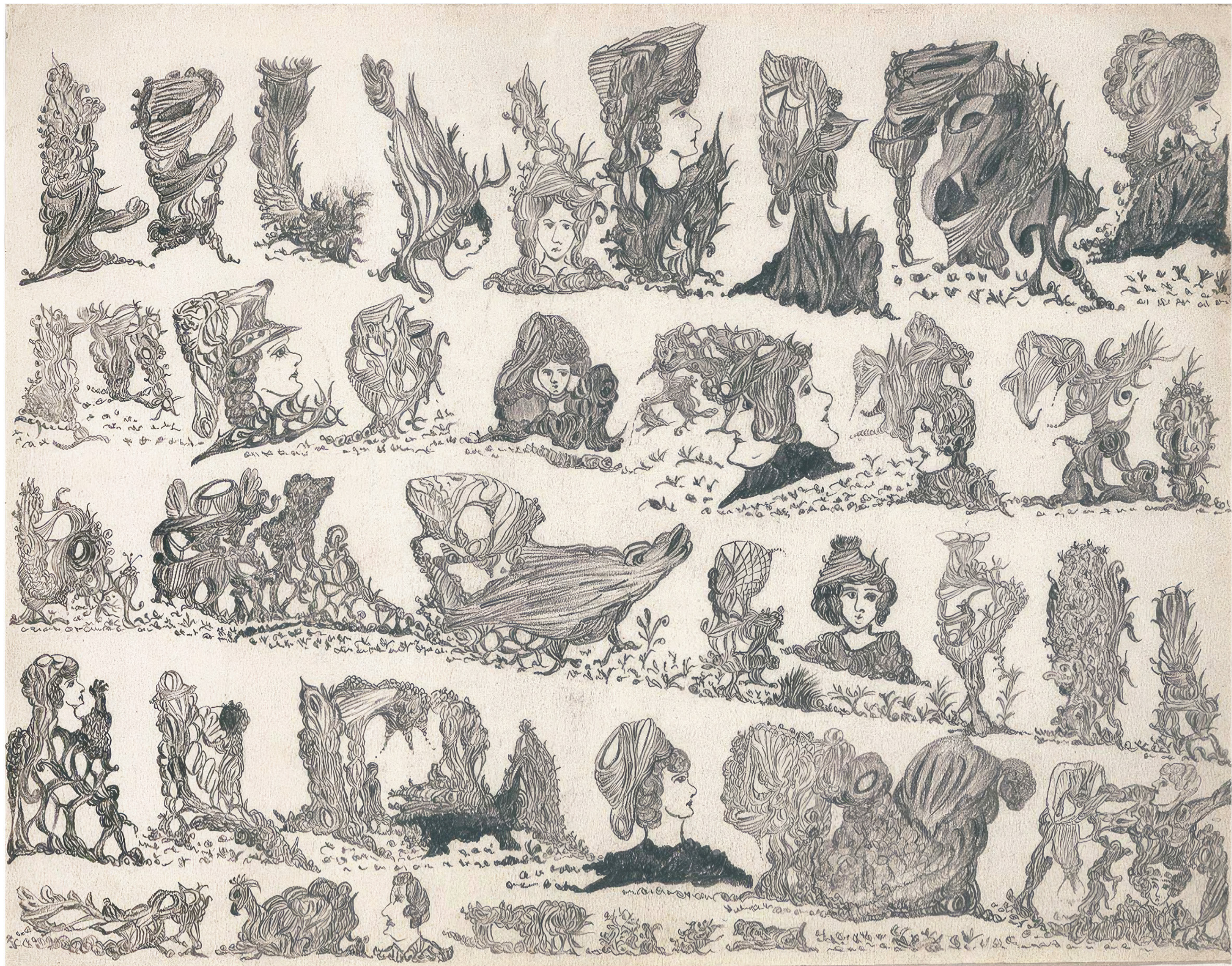
Raphaël Lonné Sans titre, 1951, mine graphite sur papier, 24,3 x 31,5 cm

ART BRUT / donatión Bruno Decharme au MNAM-CP / 2021