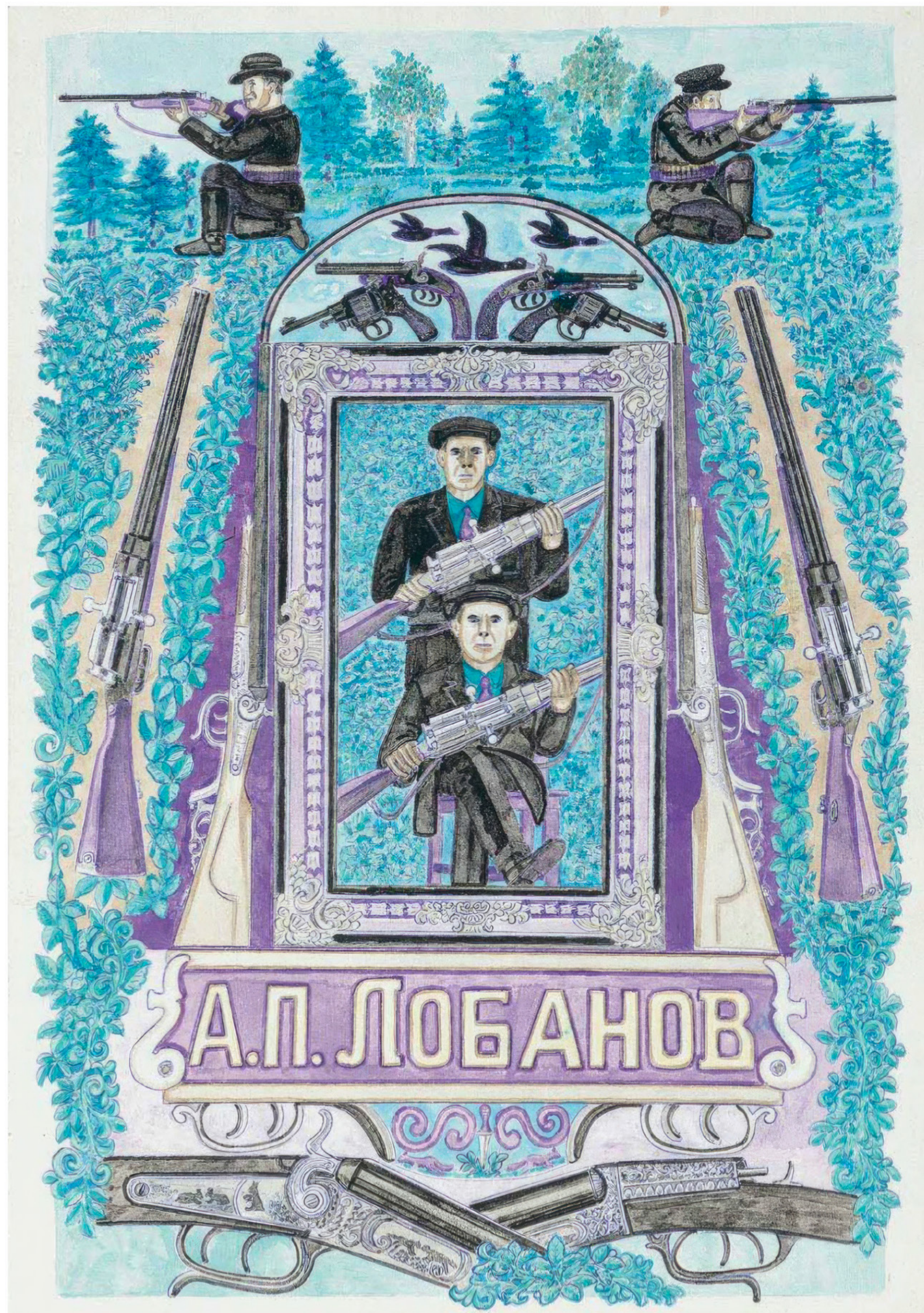
Aleksander Lobanov Sans titre, vers 1960, encre, aquarelle, crayon de couleur et mine graphite sur papier, recto verso, 41,5 × 29,2 cm

ART BRUT / donation Bruno Decharme au MNAM-CP / 2021