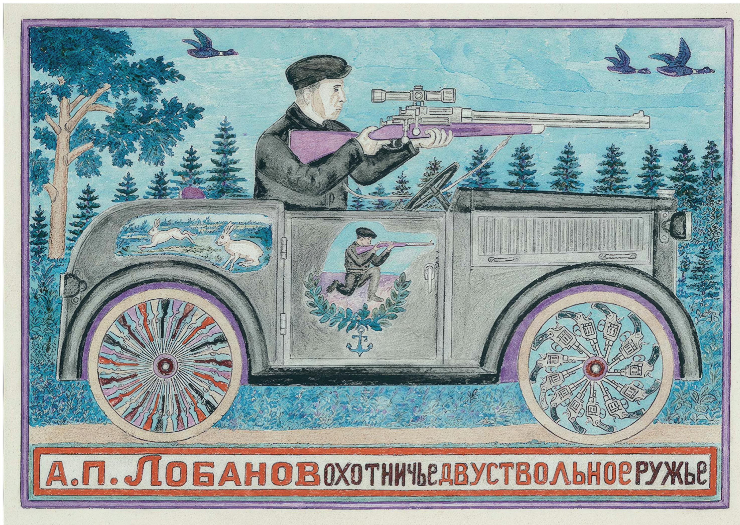
Aleksander Lobanov Sans titre, vers 1960, encre, aquarelle, crayon de couleur et mine graphite sur papier, recto verso, 29,5 x 41,6 cm