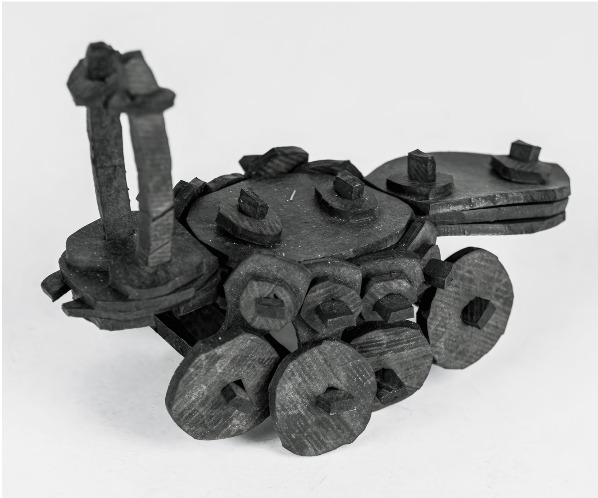
Daldo Marte Limonta Sans titre, de la série Insectoides híbridos , 2022, caoutchouc recyclé, 16 x 8 x 12 cm

ART BRUT / donation Bruno Decharme au MNAM-CP / 2021 Don de l'artiste et de Rosmy Porter à la coll. Decharme