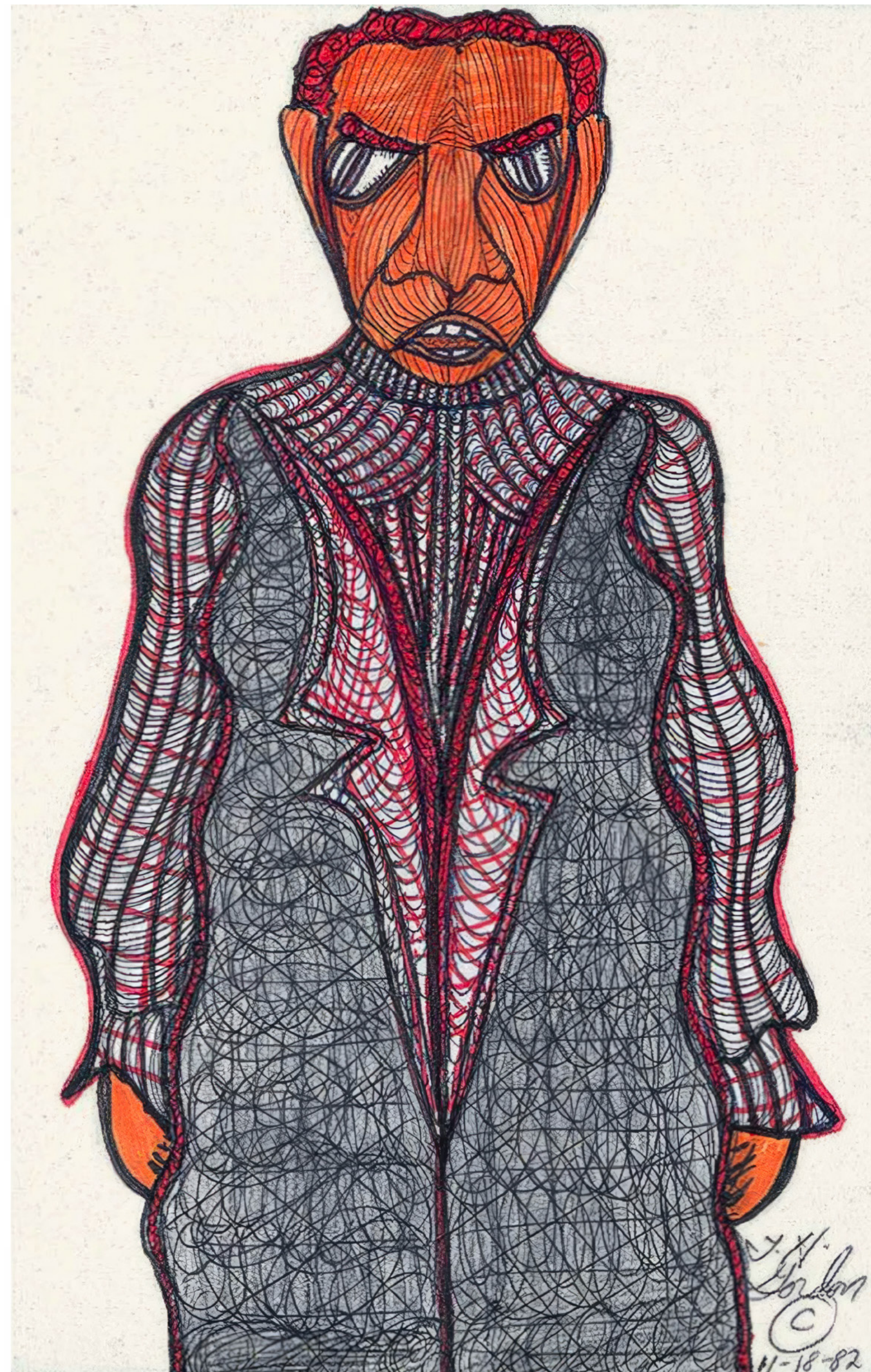
Ted Gordon Sans titre, 11.18.82, stylo à bille, feutre et mine graphite sur papier, 21,5 x 14 cm

ART BRUT / donation Bruno Decharme au MNAM-CP / 2021