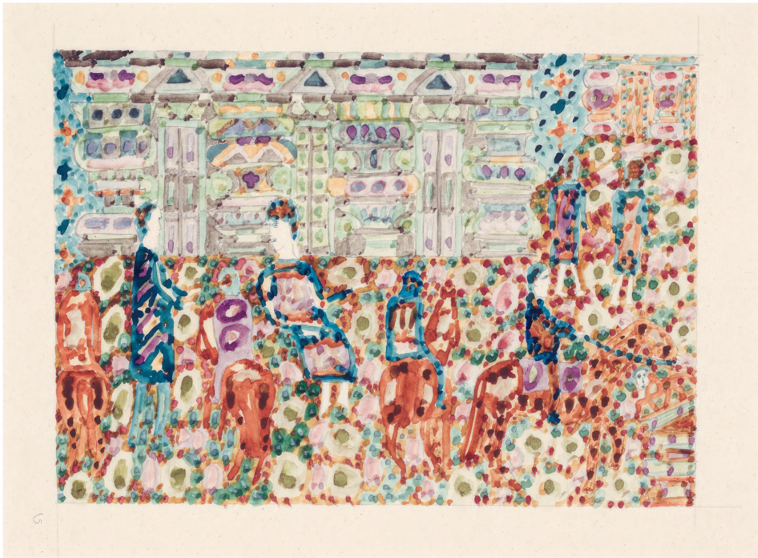
Paul Goesch Sans titre, vers 1917, aquarelle sur papier, 13 × 17,3 cm

ART BRUT / donation Bruno Decharme au MNAM-CP / 2021