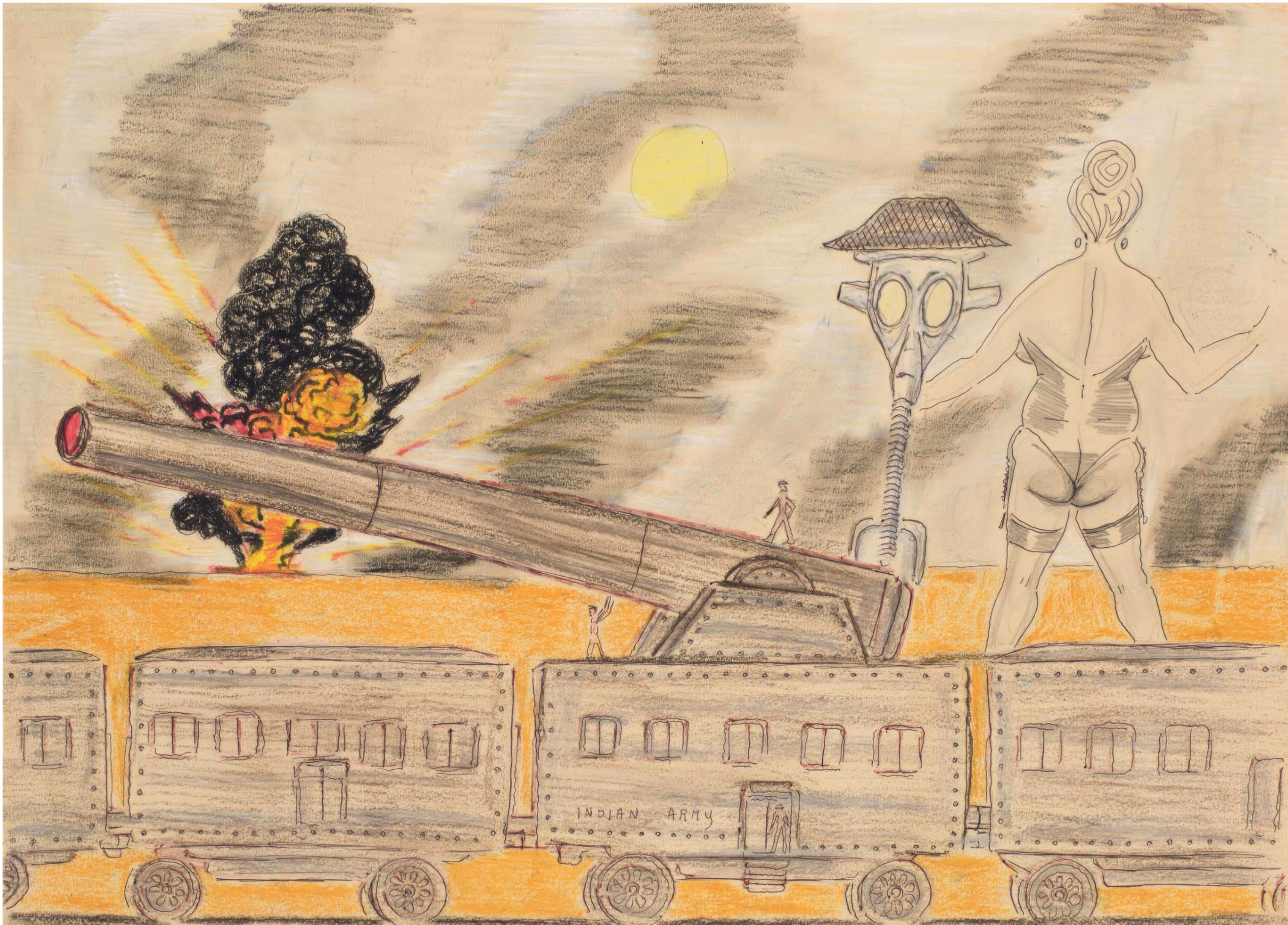
Giovanni Galli Indian army , vers 2000, encre, mine gra- phite et pastel sur papier, 50 x 71 cm

ART BRUT / donation Bruno Decharme au MNAM-CP / 2021