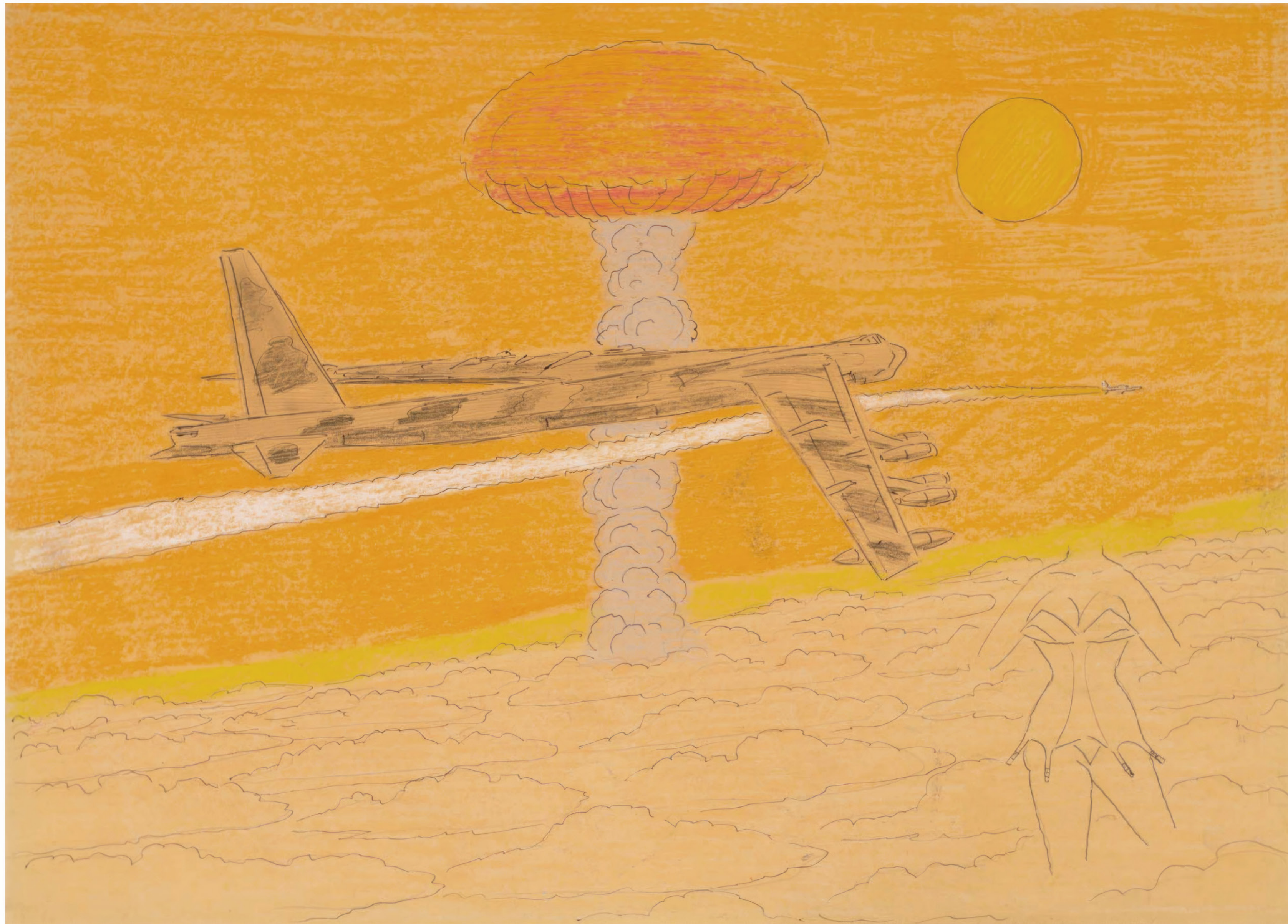
Giovanni Galli Sans titre, vers 2000, recto-verso, crayon de couleur, stylo à bille et mine graphite sur papier, 49,9 x 70,1 cm

ART BRUT / donation Bruno Decharme au MNAM-CP / 2021