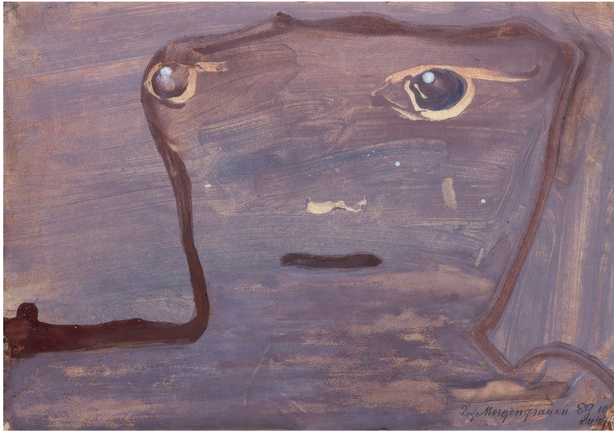
Eugen Gabritschewsky Sans titre, 1947, gouache sur papier, 20,8 x 29 cm

ART BRUT / donation Bruno Decharme au MNAM-CP / 2021