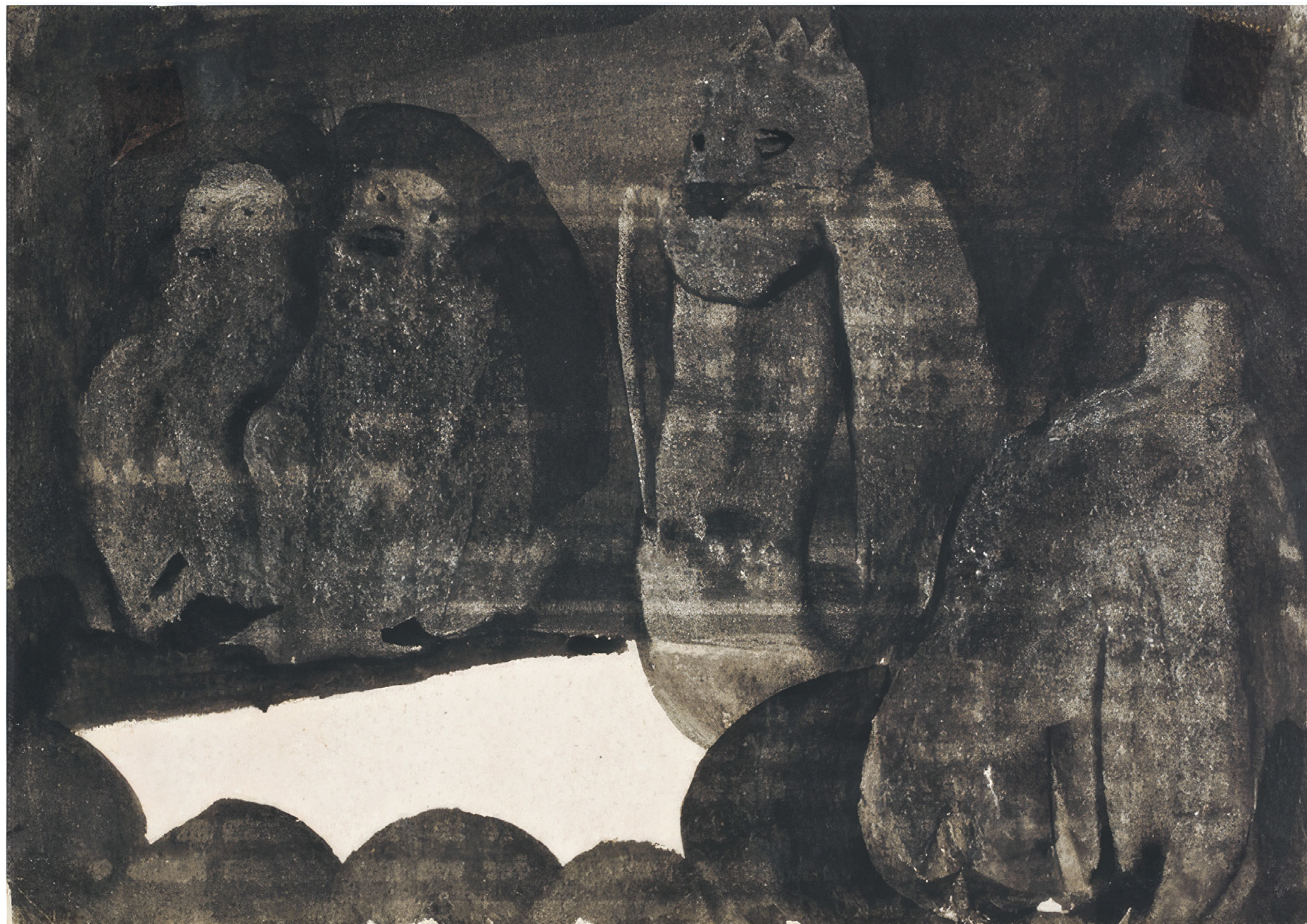
Eugen Gabritschevsky Sans titre, vers 1950, gouache sur papier, 15 x 21 cm

ART BRUT / donation Bruno Decharme au MNAM-CP / 2021