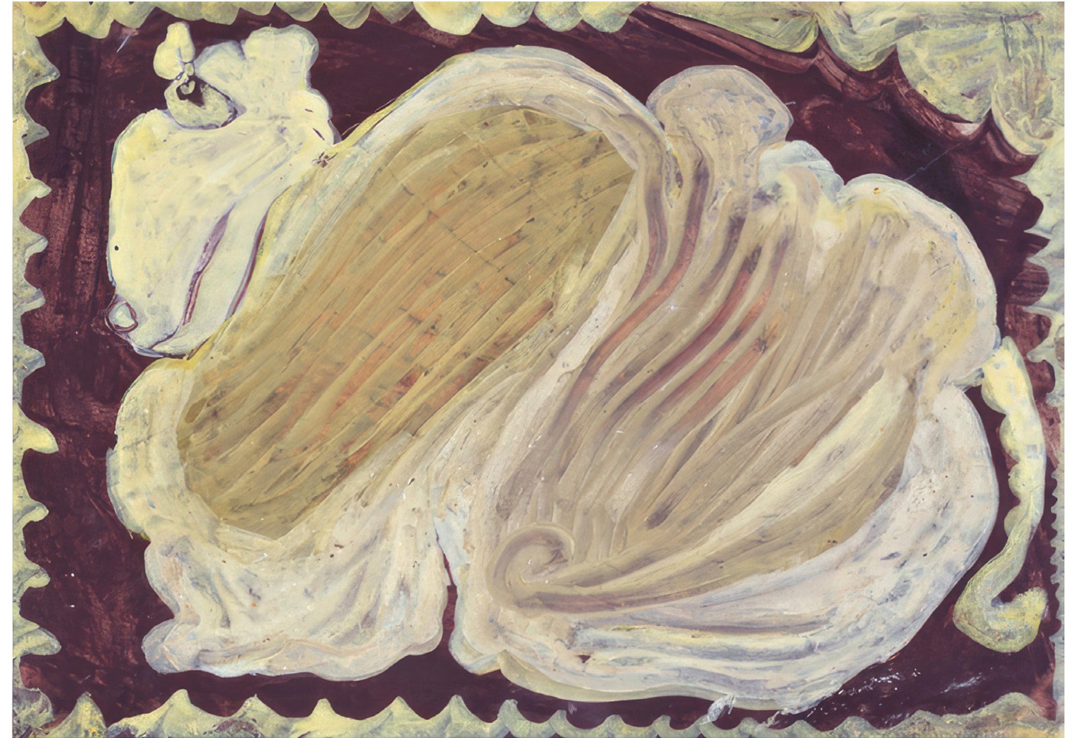
Eugen Gabritschewsky Sans titre, vers 1950, gouache sur papier, 20,9 x 29,5 cm

ART BRUT / donation Bruno Decharme au MNAM-CP / 2021