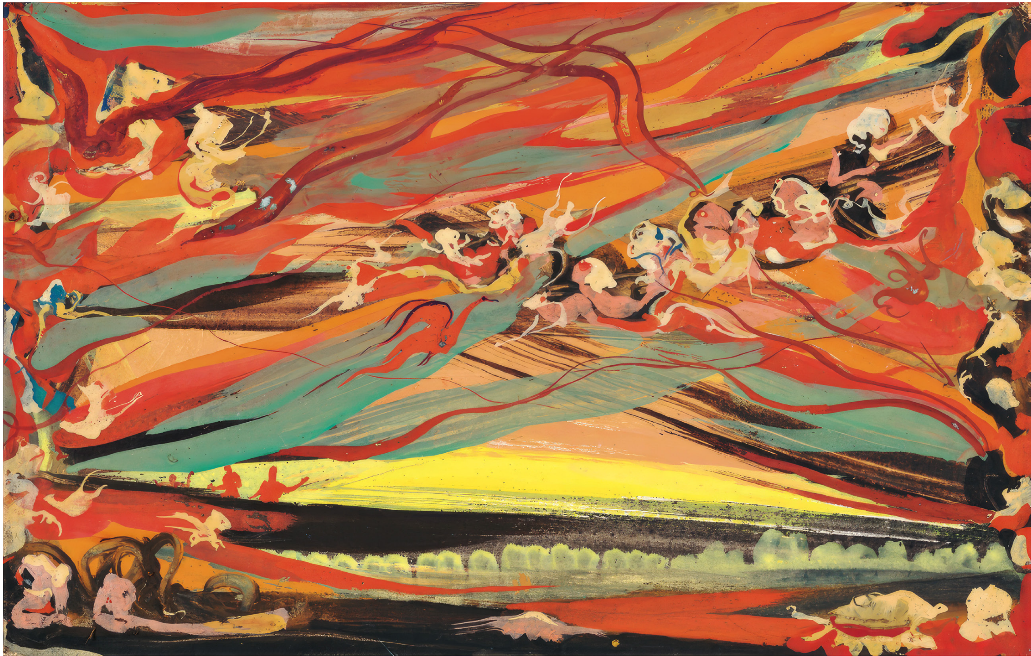
Eugen Gabritschewsky Sans titre, vers 1950, gouache sur papier, 24,5 × 38,5 cm,

ART BRUT / donation Bruno Decharme au MNAM-CP / 2021