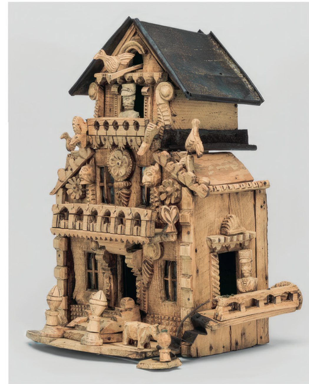
Auguste Forestier Sans titres, entre 1935 et 1949, bois sculpté, caoutchouc, corde- lette-élastique, crin, cuir, dents de porc, élastomère, ficelle, film plas- tique, linoléum, métal, peau de mouton, peinture plumes, tissu, toile cirée, verre, h. entre 10 et 67 cm, l. entre 16 et 58,5 cm, p. entre 4 et 33 cm