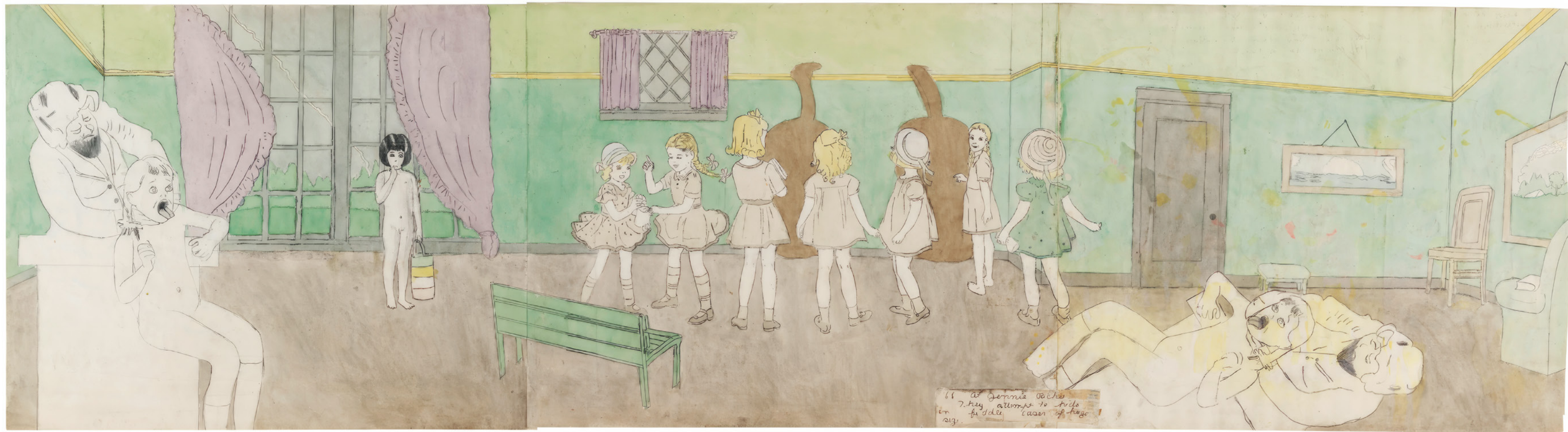
Henry Darger At Jennie Richee – They attempt to hide in fiddle cases of huge size... et At MC Hollester run second battle, they are pursued still..., recto verso, entre 1950 et 1960, aquarelle et mine graphite sur papier, 48 × 178 cm