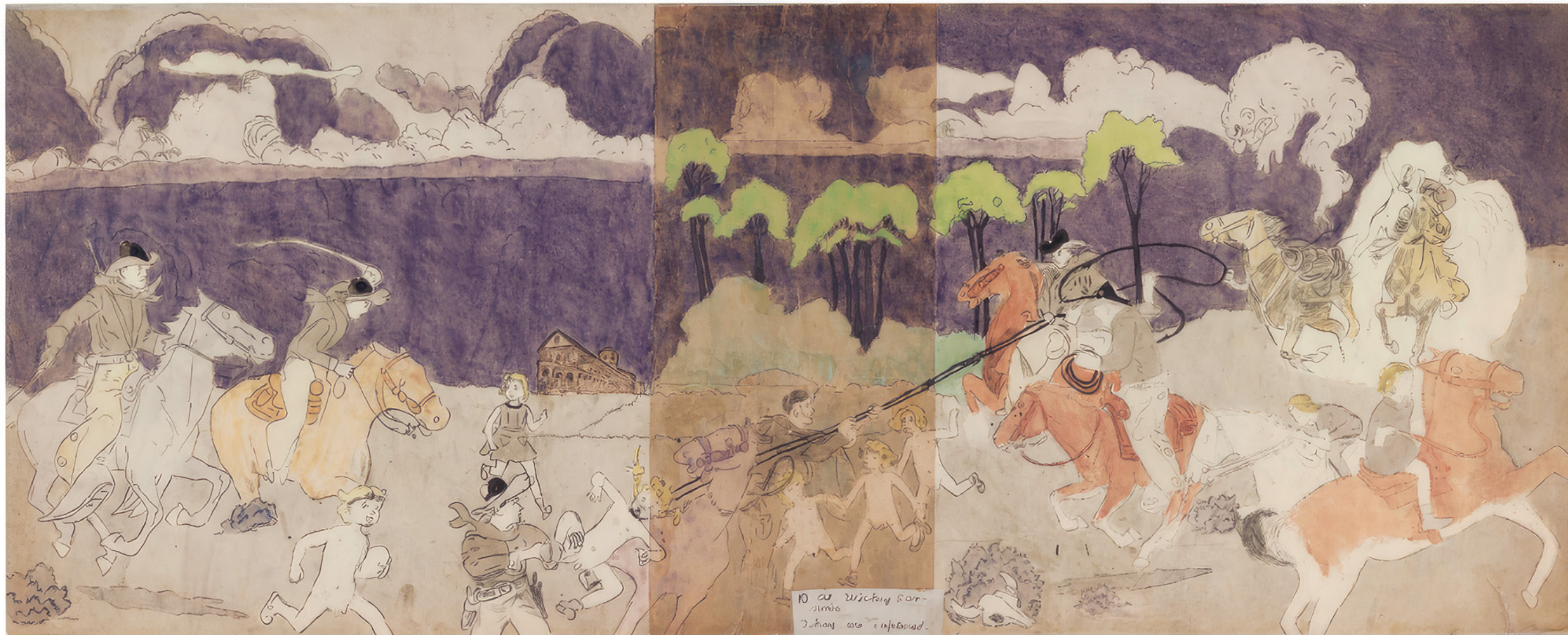
Henry Darger At Jullio Callio vice norma rescuers come the wicked execution... et At Wickey San-Rinia – They are captured... , recto verso, entre 1950 et 1960, aquarelle, encre, mine graphite et collage sur papier, 48 × 120,5 cm