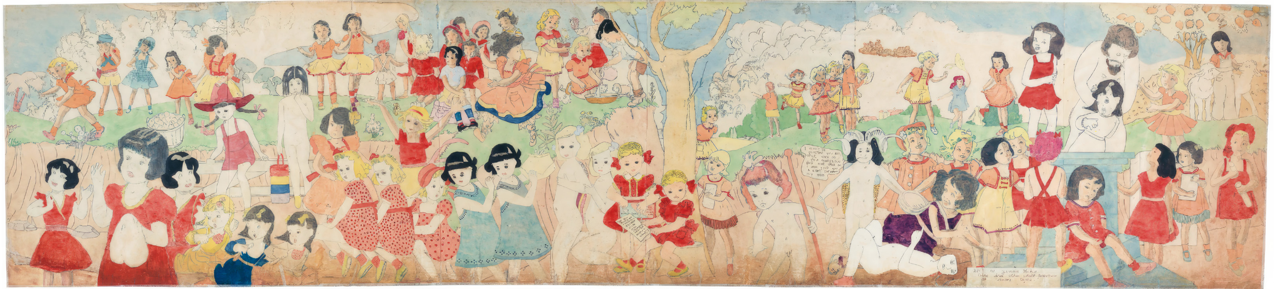
Henry Darger, At Jennie Richee – Break out of prison camp killing or wounding guards et At Jennie Richee – Also free other child prisoner at same time, , recto verso, entre 1950 et 1960, ronéotype, aquarelle, mine graphite et collage sur papier, 60 × 274 cm