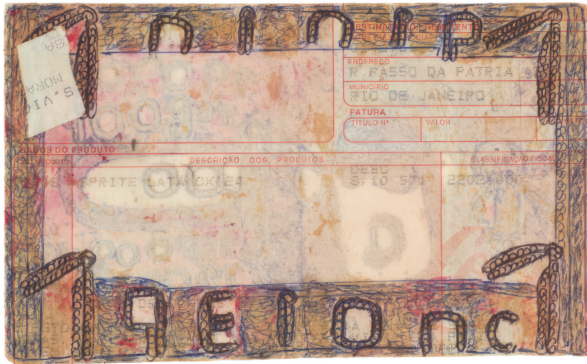
Raimundo Camilo Sans titre, s.d., stylo à bille et gouache sur papier imprimé (recto), stylo à bille, gouache, collage et ruban adhésif sur papier imprimé (verso), 9,2 × 15,2 cm

ART BRUT / donation Bruno Decharme au MNAM-CP / 2021