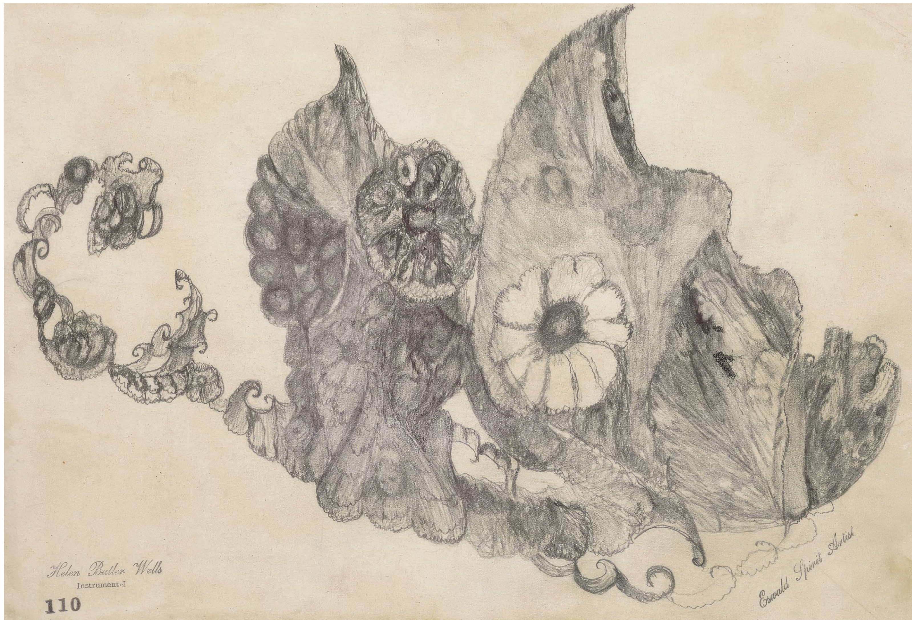
Helen Butler Wells Sans titre, vers 1920, mine graphite et tampon sur papier, 18,7 × 27,5 cm