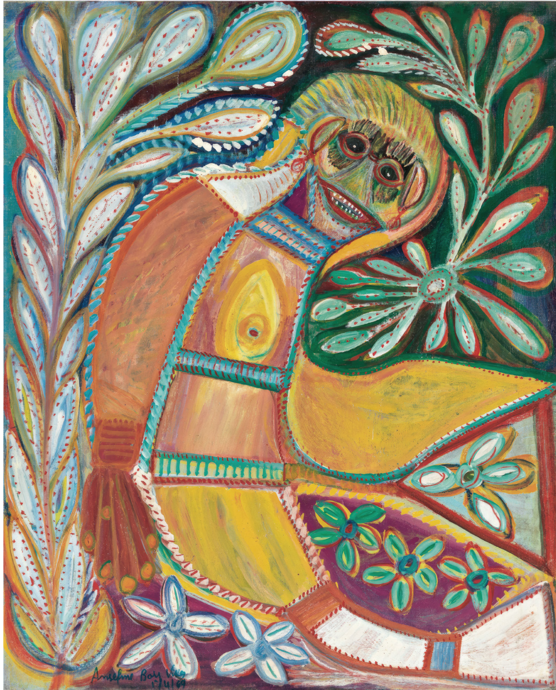
Anselme Boix-Vives Grande figure , 1er avril 1969, Ripolin et gouache sur toile, 100 × 81 cm

ART BRUT / donation Bruno Decharme au MNAM-CP / 2021