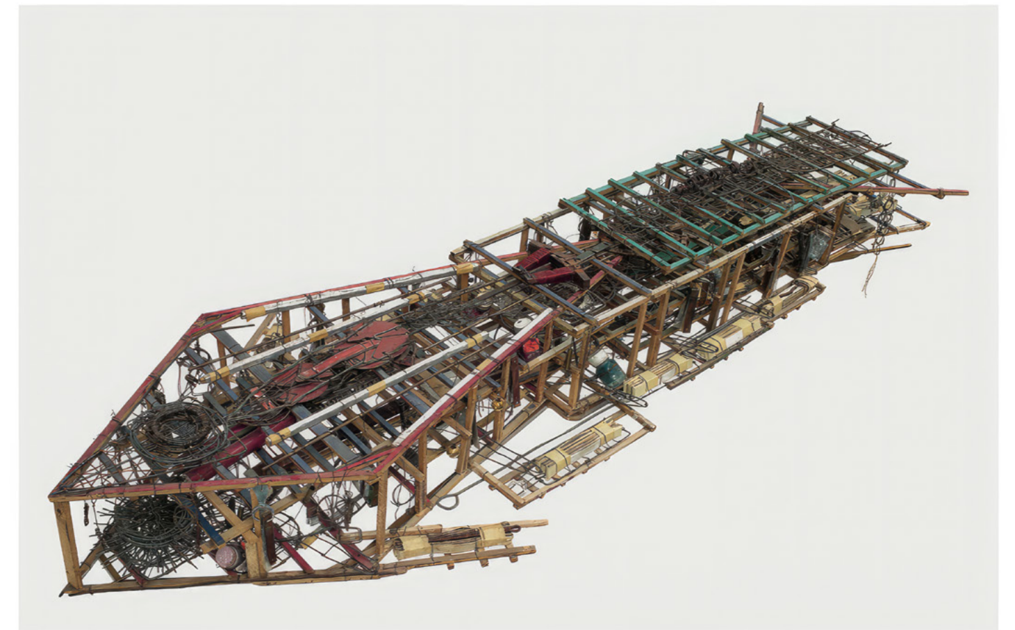
Emery Blagdon Rocket, entre 1956 et 1986, bois, métal (cuivre, aluminium), scotch, papier, plastique, film plastique, verre, condensateurs chimiques, batterie, 21,2 × 152,5 × 54 cm

ART BRUT / donation Bruno Decharme au MNAM-CP / 2021