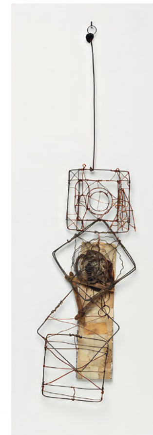
Emery Blagdon Sans titre, entre 1956 et 1986, bois, métal (cuivre), fibres végétales, 18,6 × 10 × 2,5 cm

ART BRUT / donation Bruno Decharme au MNAM-CP / 2021