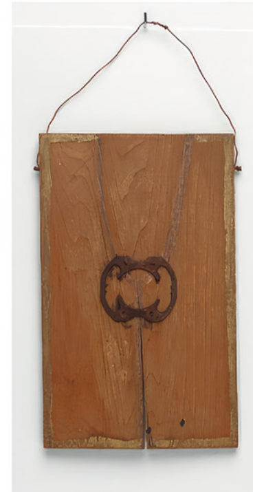
Emery Blagdon Sans titre, entre 1956 et 1986, bois, métal, film plastique, 15,1 × 9,2 × 2,8 cm

ART BRUT / donation Bruno Decharme au MNAM-CP / 2021