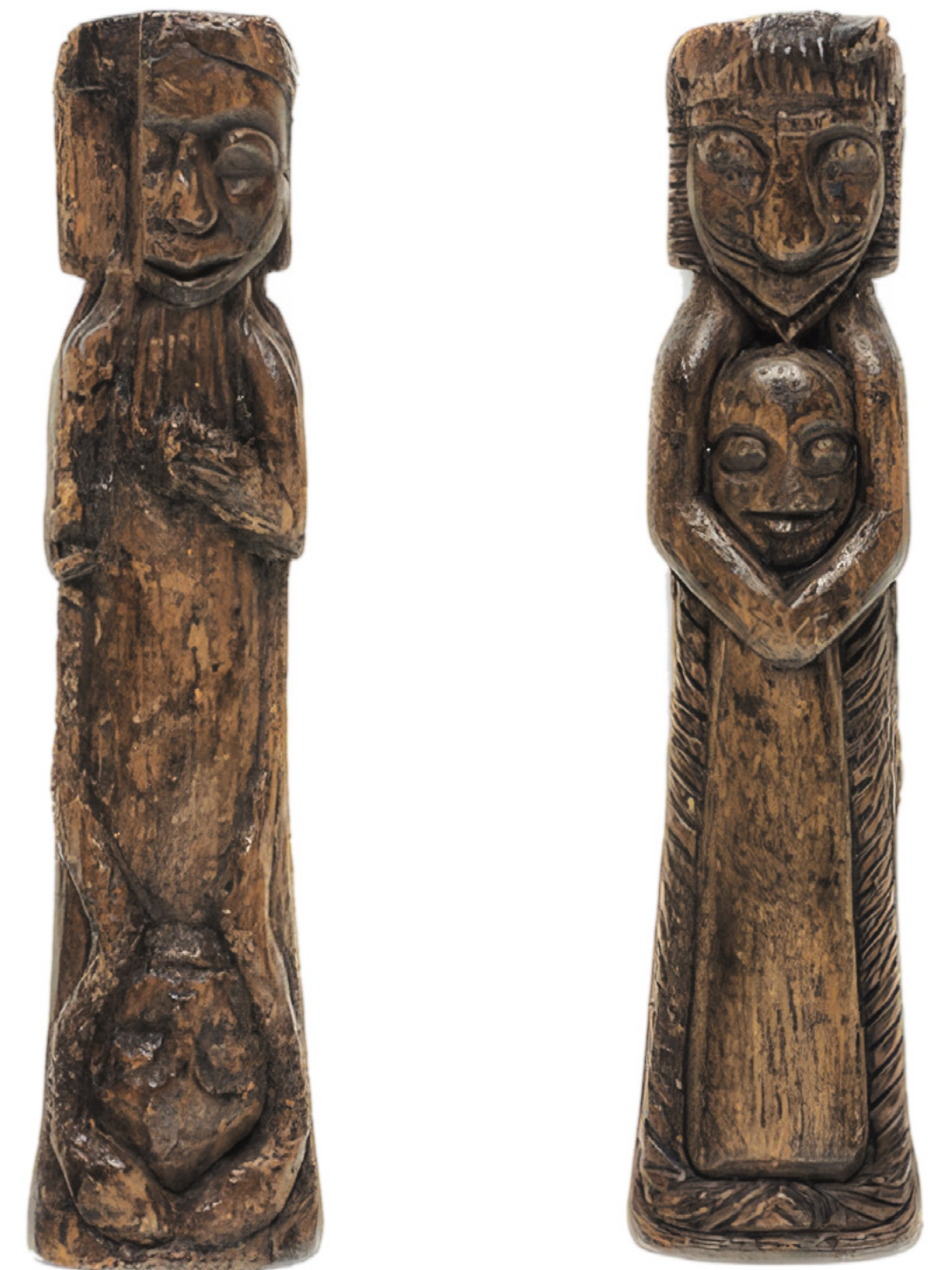
Anonyme (Brésil), sans titre, recto verso, vers 1930, bois sculpté, 11 × 2,7 × 2 cm

ART BRUT / donation Bruno Decharme au MNAM-CP / 2021