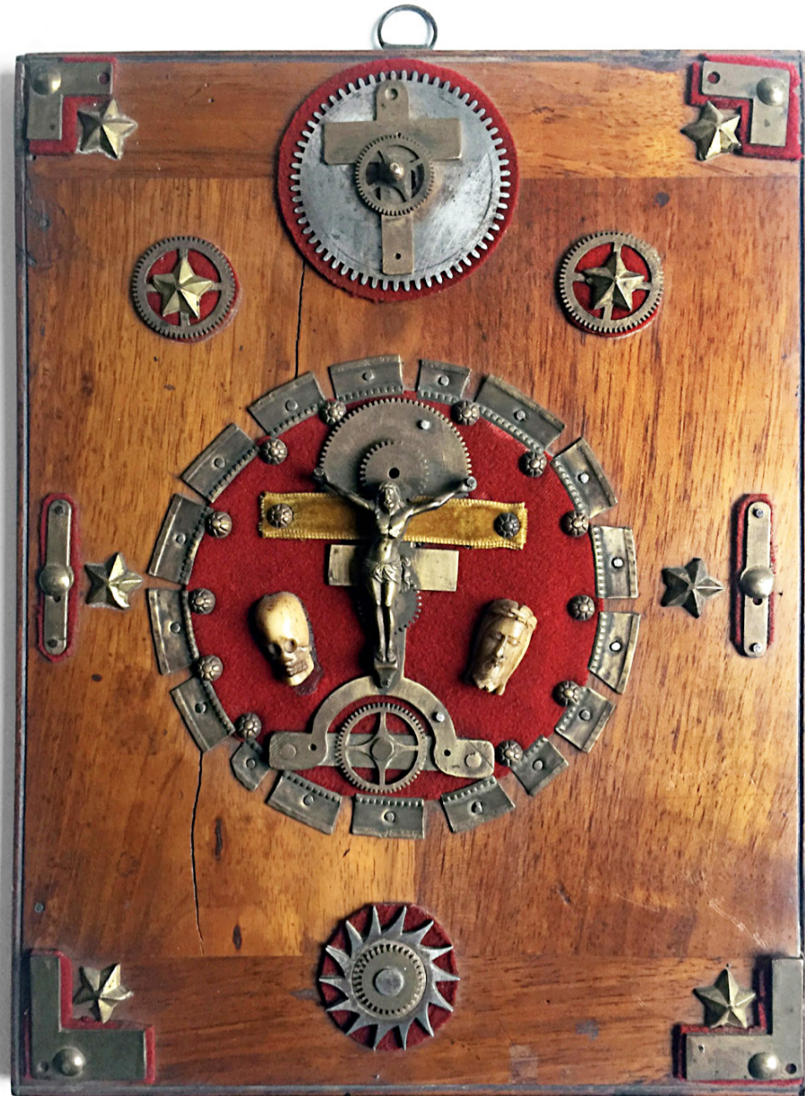
Anonyme (Brésil), Sans titre, vers 1930, bois, métal, pièces d'horlogerie, ivoire, tissu, 25,2 × 19,2 × 2,5 cm

ART BRUT / donation Bruno Decharme au MNAM-CP / 2021