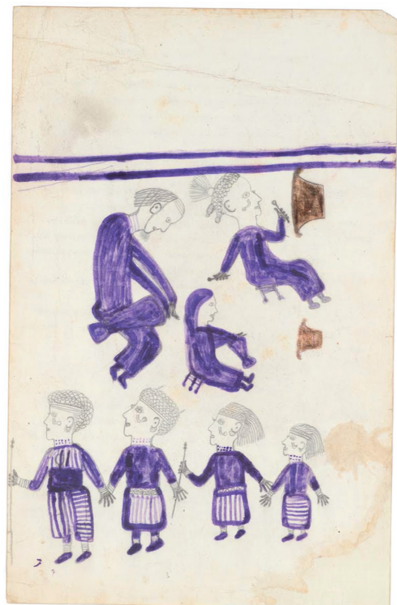
Anonyme (Angola) Sans titres, vers 1960, mine graphite, feutre, crayon de couleur et pigment au verso de pages de protocoles médicaux, 32 ou 32,5 × 20,5 ou 21 cm (chacun)

ART BRUT / donation Bruno Decharme au MNAM-CP / 2021